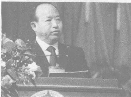
原四川绵阳市市委书记