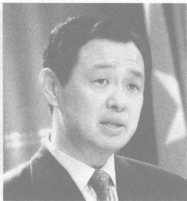
中国外交部发言人 孔泉