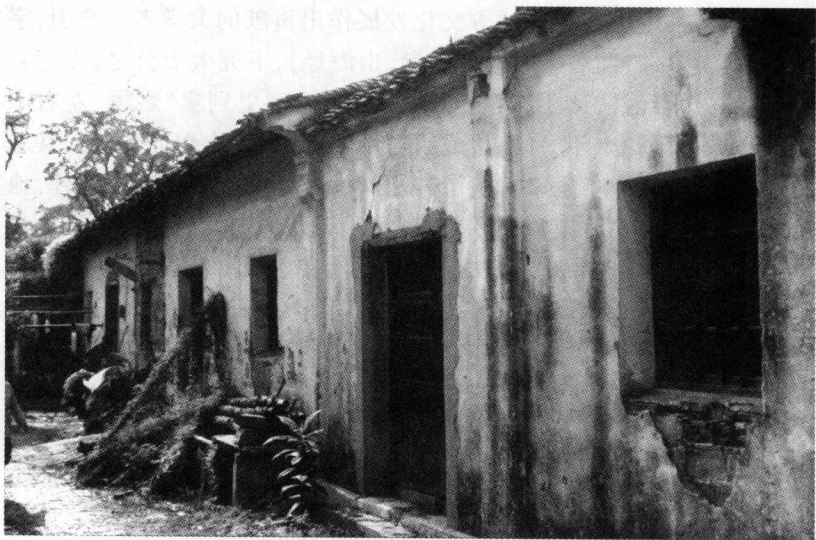
(明)翁家祠堂:位于翁巷村

1717),字式金,号琢山。文章举笔立就,句多奇惊。中康熙五十六年(1717)的举人,著有《蜗庐诗存》7卷。《七十二峰足征集》收其诗106首。清代《国朝诗别裁集》也收录他6首诗。除此以外,东山翁氏在《江苏艺文志》上有诗作和人物简介的还有翁美、翁相国等。