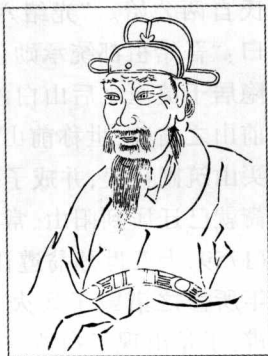
(南宋)翁承勋:迁山始祖,亲军侍卫都统制

始迁东山。 北宋末年发生靖康之变,金兵攻陷开封,北宋灭亡。南宋建立后,金兵不断南侵,中州及两淮之民大举奔逃过江,出现了