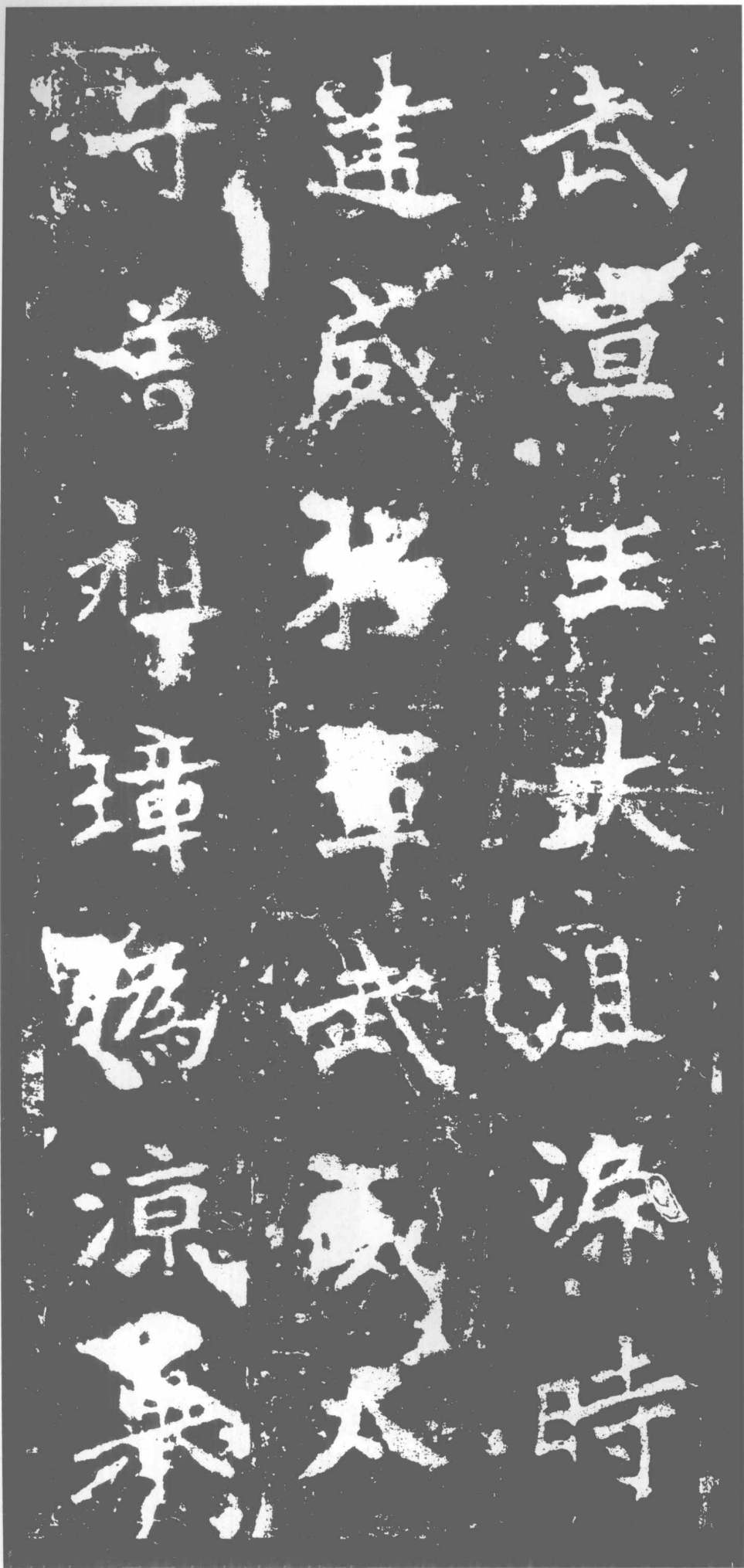
武宣王。大沮渠时。建威将军。武威太守。曾祖璋。伪凉举