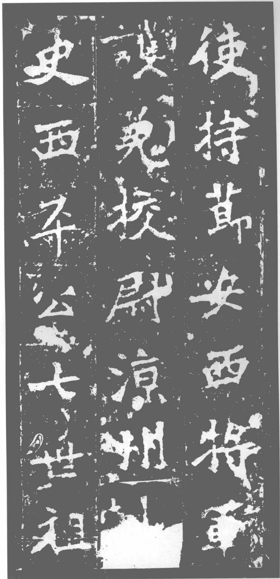
使持節·安西將軍· 護羌校尉·涼州刺史·西平公·七世祖