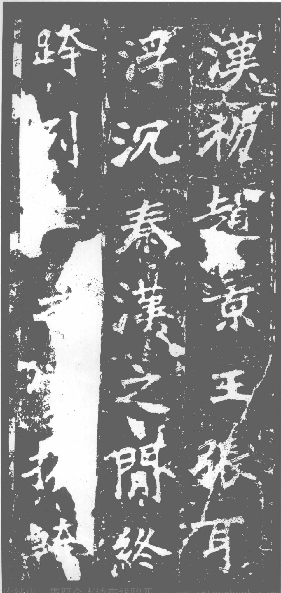
汉初赵景王张耳。浮沉秦汉之间。终跨列土之赏。材干