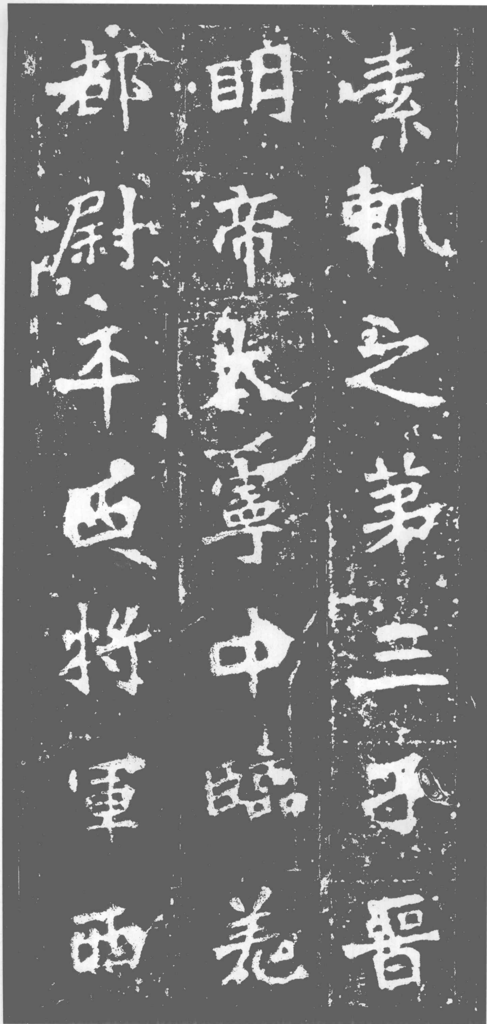
素。軌之第三子。晋 明帝太宁中。临羌 都尉·平西将军·西