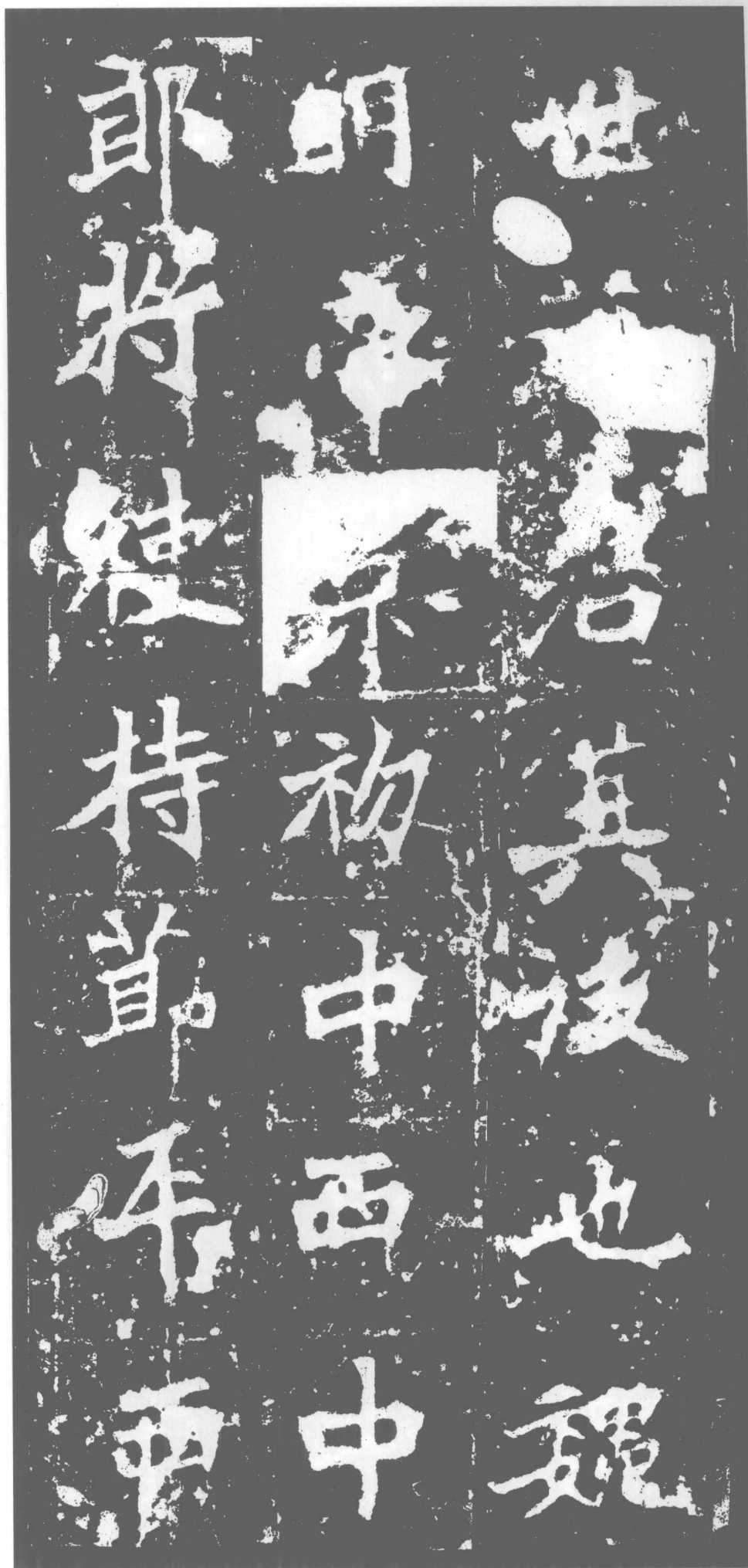
世著。君其後也。魏 明帝景初中。西中 郎將。使持節。平西