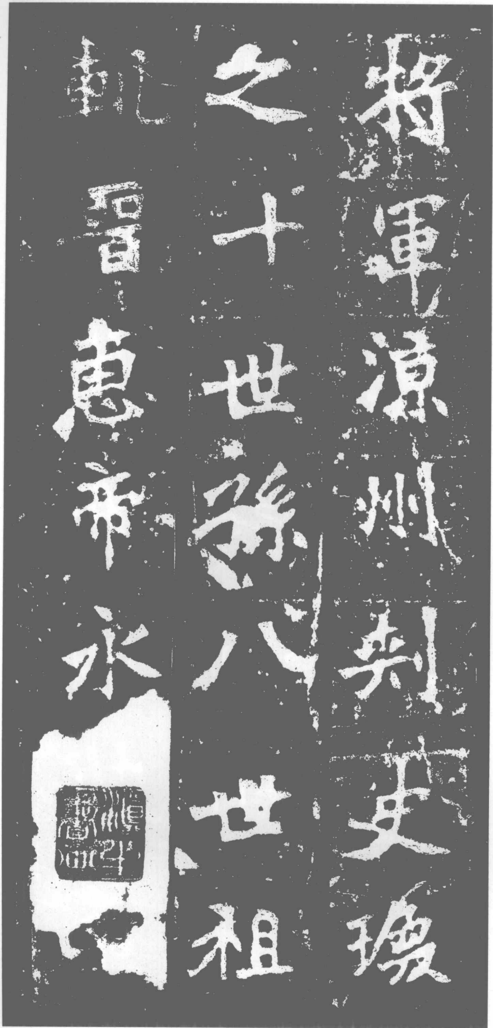
將軍·涼州刺史·瓌 之十世孫·八世祖 軌·晉惠帝永興中。