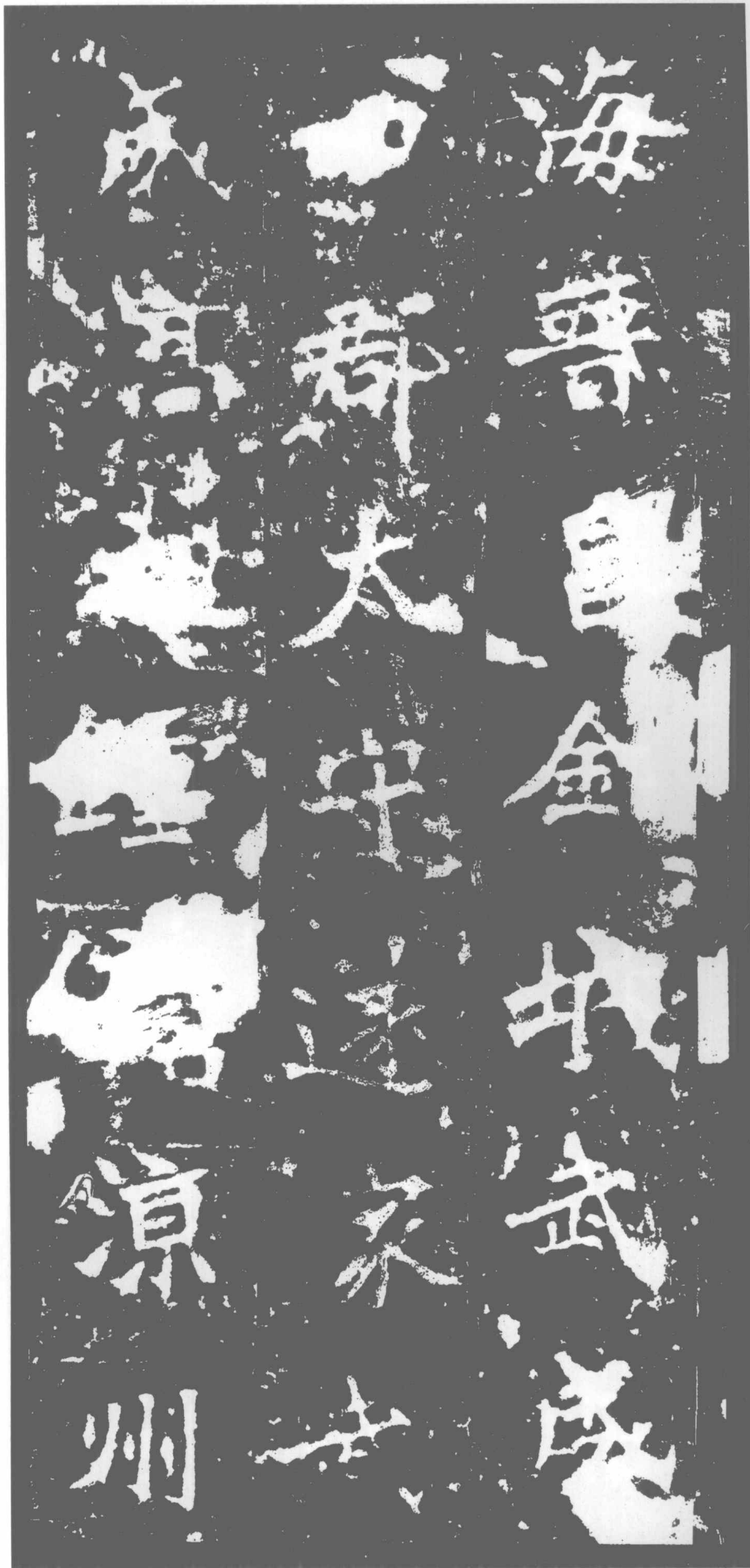
海·晉昌·金城·武威·四郡太守·遂家武威·高祖鍾信·涼州