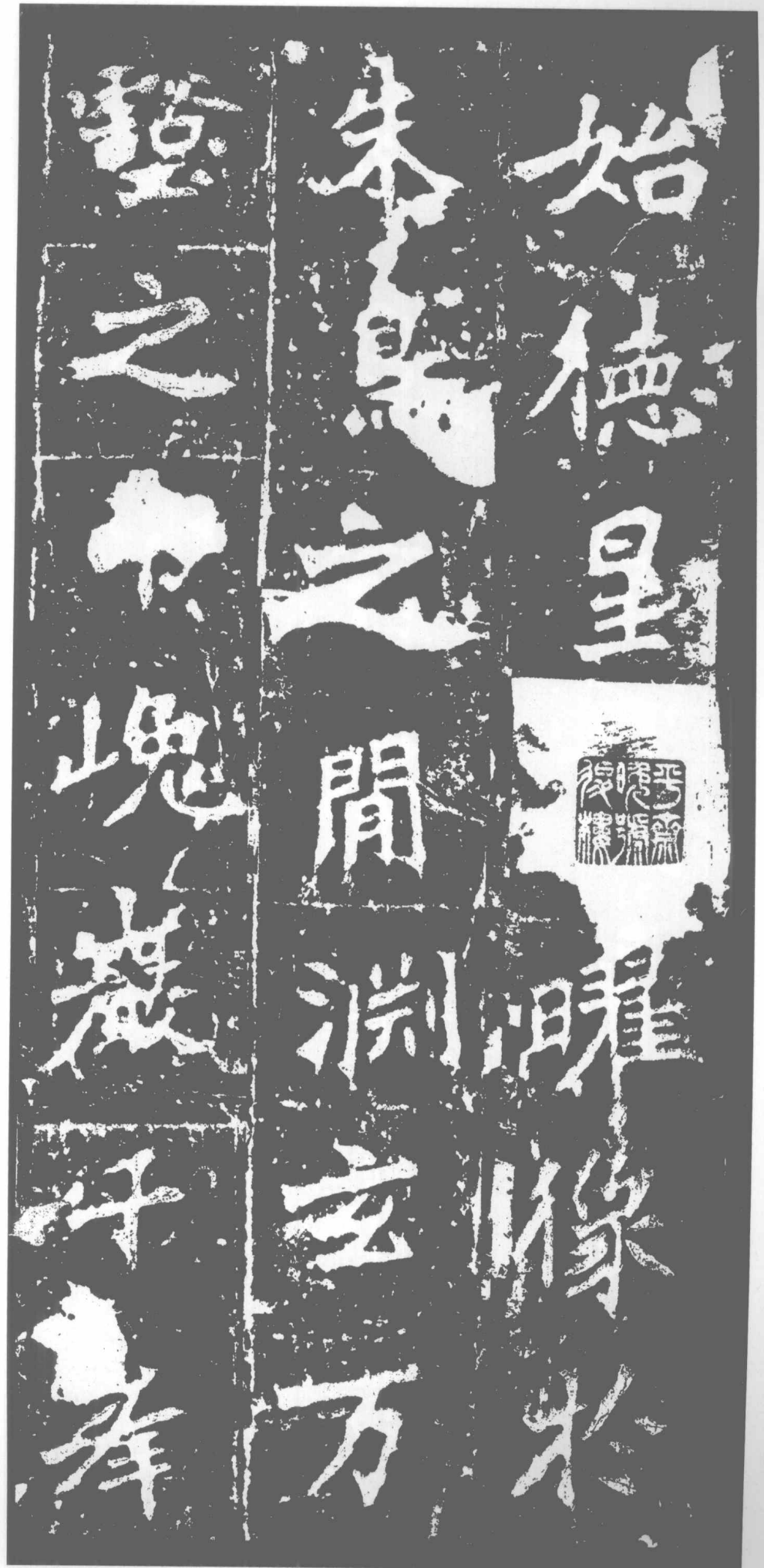
始。德星□□。曜像于朱鸟之间。渊玄万壑之中。峻岩千峰