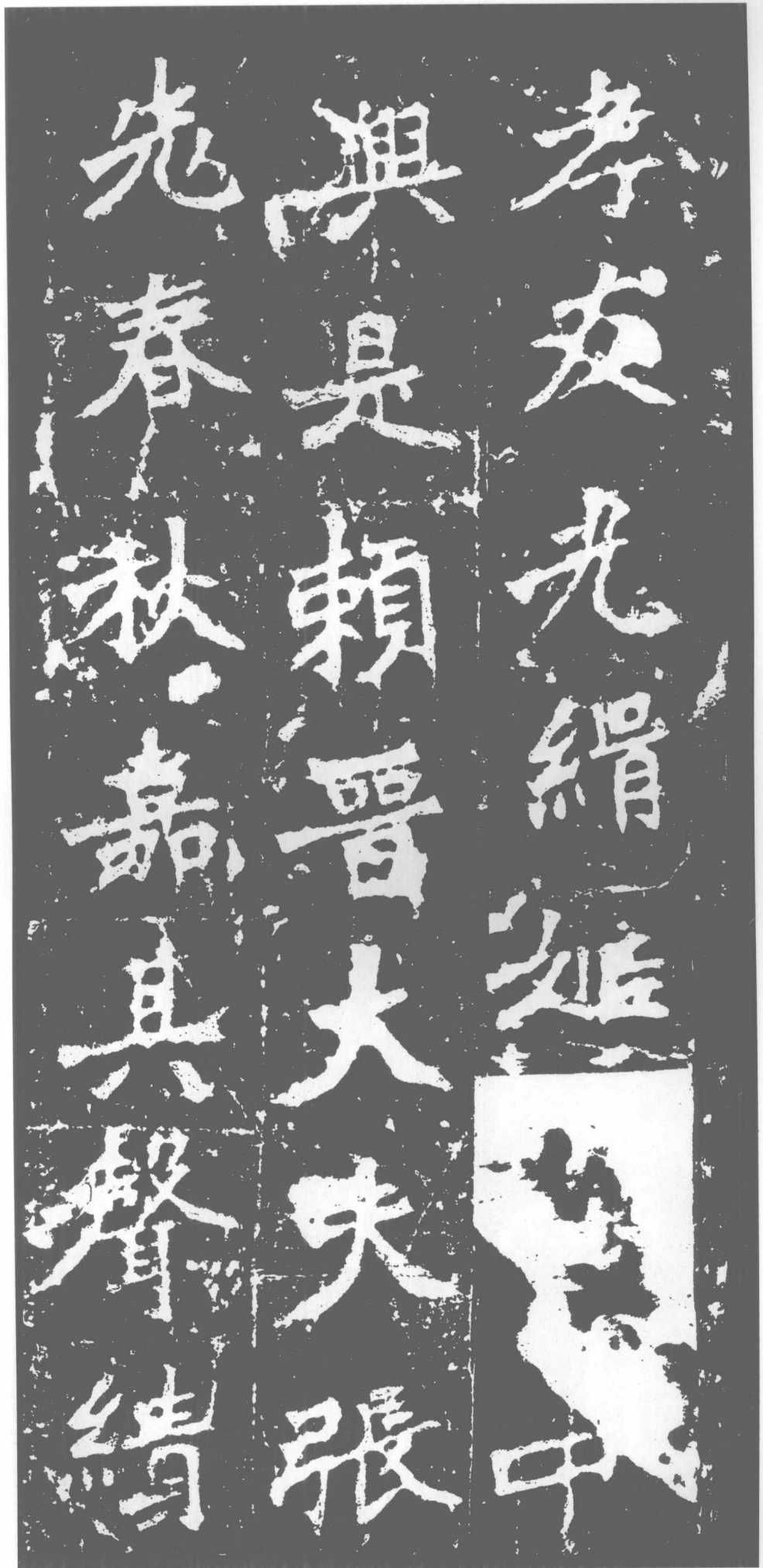
孝友。光緝姬□。中 兴是赖。晋大夫张 老。春秋嘉其声绩。