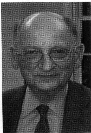
奥托·克恩伯格 (Otto Kernberg, 1928~)