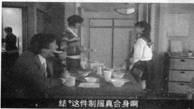
结°这件制服真合身啊