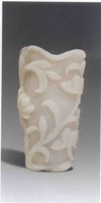
清 (19 世紀) 白玉蓮葉式瓶 尺寸: 高 10.5cm 拍賣時間: 1995 年 5 月 1 日 估價: HKD30,000 — 35,000 成交價: HKD28,750