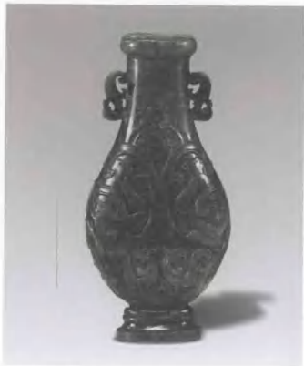
18世紀 碧玉雕螭紋瓶(二件)