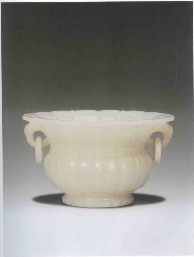
清 乾隆 (1736 - 1795) 白玉雙耳活環蓮瓣式敞口瓶 尺寸：口徑 15cm 拍賣時間：1996 年 11 月 3 日 估價：HKD250,000 - 350,000