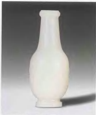
清乾隆 (1736—1795) 白玉龍鳳紋瓶