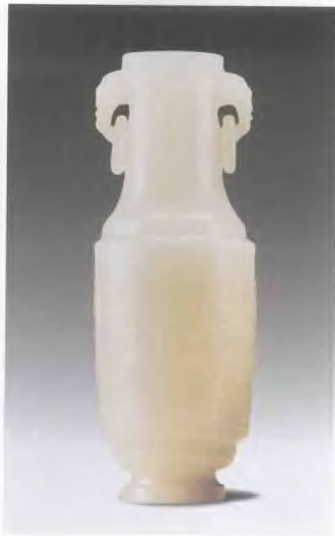
18世紀 白玉瓶 尺寸：高13.2cm 拍賣時間：1996年12月17日 估價：GBP1,500—2,000 成交價：GBP5,750