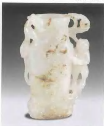
清中期 玉雕祥雲如意童子小瓶