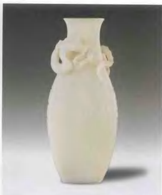
18/19 世紀 白玉透雕龍鳳紋瓶