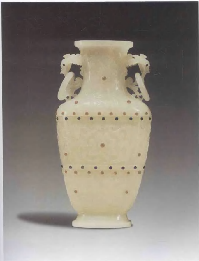
19 世紀 白玉淺雕花龍嵌紅藍寶石雙環耳瓶 尺寸：高 15.2cm 拍賣時間：1993 年 11 月 29 日 估價：USD15,000 - 20,000