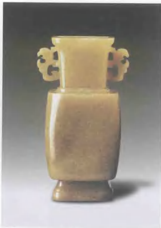
清(18世紀) 黃玉龍耳方瓶