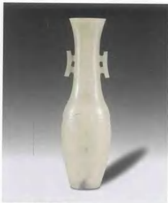
清中期 青玉刻蝕紋雙耳瓶