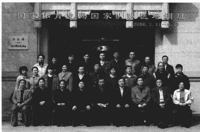
图 1 培训班全体学员合影

为适应备战 2008 年奥运会需要，提高我国国家队队医及相关科研人员综合素质和技能，国家体育总局于 2006 年 3 月 31 日