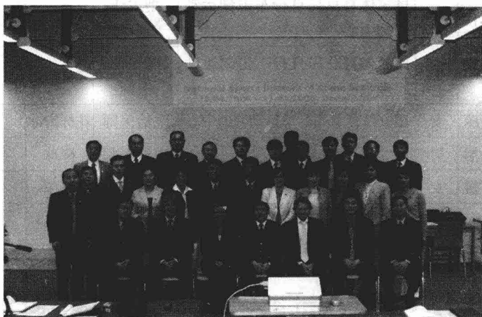
图2 培训班学员与德国专家合影