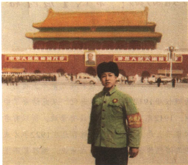
去兵团前在天安门前留影