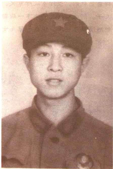
▶ 我年轻时的参军照

当时的我并不明白，一个个故事的背后，主人公隆裕皇后都有着怎样的心酸。似乎，那些故事都离我太远了，远得像个神话；又似乎是从身边经过，但你永远抓不住的影子一样。虽然故事过去那么多年了，但讲到动情的地方，爷爷还是忍不住老泪纵横。这个时候，我们几个通常都会拿衣角悄悄为爷爷擦掉眼泪，然后爷爷就意识到自己沉浸在过去的岁月里了，马上从嘴角挤出一个笑来，我的心情也就跟着兴奋起来。但当时我并不理解爷爷为什么满脸的无奈，甚至并不知道这个从来只是听说而没见过面的隆裕跟我到底有什么关系。