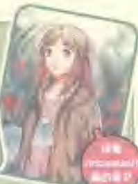
冰室姐 (Icecream) 明眼儿