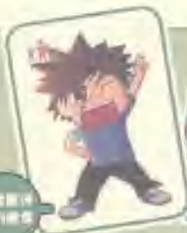
宫平花妙 波叔的妈

在“包租婆”的火力大压下，唐李最终会当上“林大”的漫画家吗？ 冰室姐的明眼儿，咬字口歪“贾麦尼”形象，在赢得大哥“波叔”妈？ 宫平花妙，PAPA 传奇，他们又高发生怎样的故事？ 212 还会有哪些新人登场？