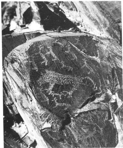
图1 猛虎捕食图 东方黑山岩画

如果从艺术的本体来考察原始艺术不能称之为艺术，之所以今天我们称其为“原始艺术”这中间存在一个长期的认识论的转换过程。因为原始社会艺术还没有达到真正的自觉，对于原始先民艺术乃是一种无意识的存在。我们今天称之为的原始艺术就其内容而言，大多表现了原始人类对生存、狩猎等原始活动的某种祭祀或崇拜。就其形式而言，他们大多采用写实的手法（东方艺术当中也包括一种有规律的抽象造型），即对被造型之物的简单再现。在此，东西方原始艺术有着很多共通之处。