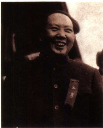
1949年10月1日下午，毛泽东在天安门城楼上（左）