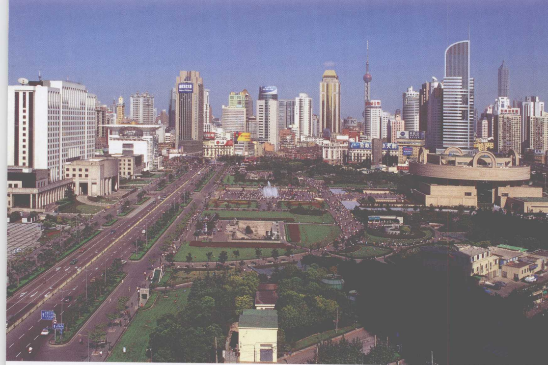
人民广场鸟瞰