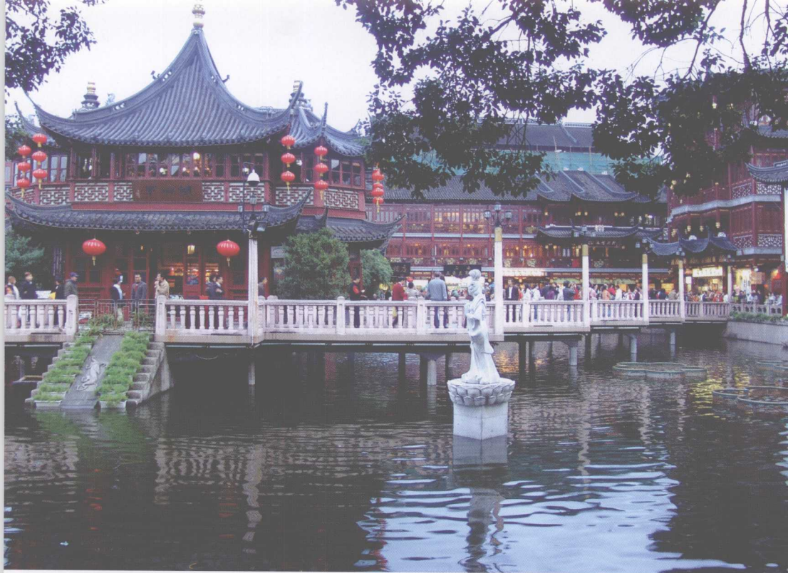
豫园九曲桥