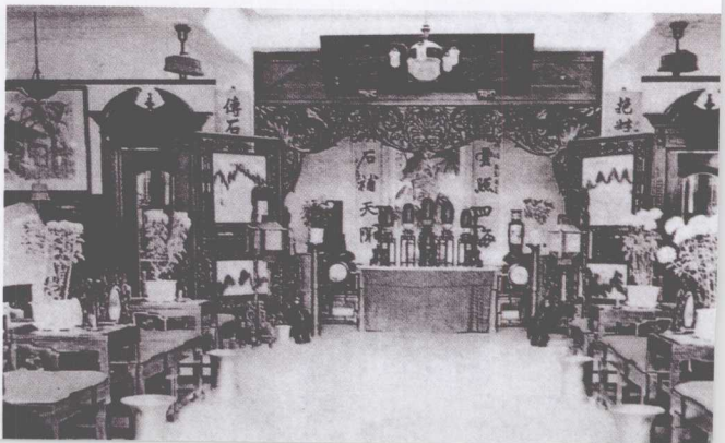
黄金荣宅内议事厅