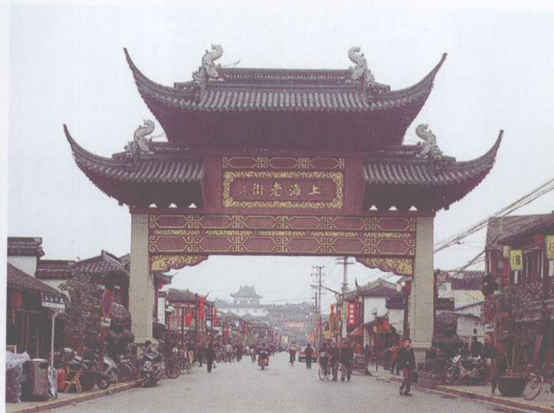
上海城隍庙老街