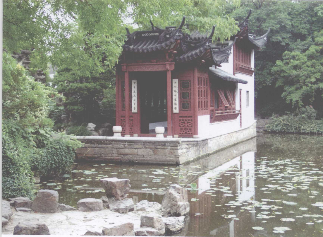
古漪园不系舟