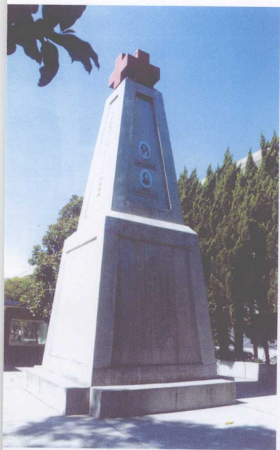
宝山罗店红十字纪念碑