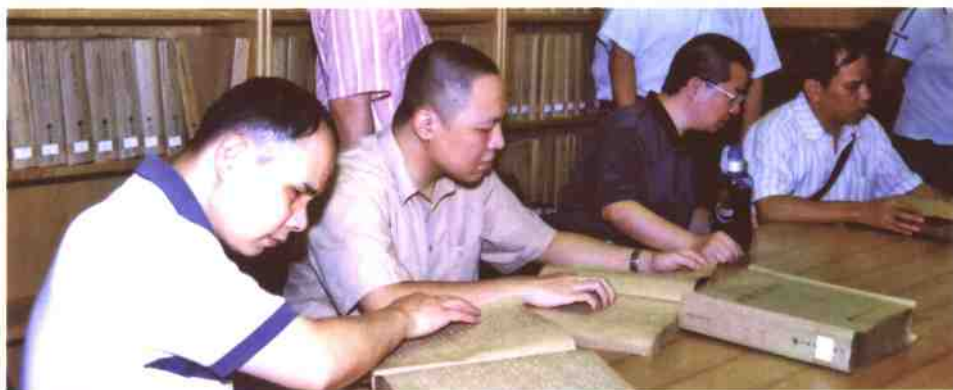
▲视障阅览室读者在阅读盲文资料