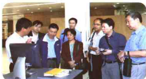
▲香港岭南大学图书馆同行访问我馆