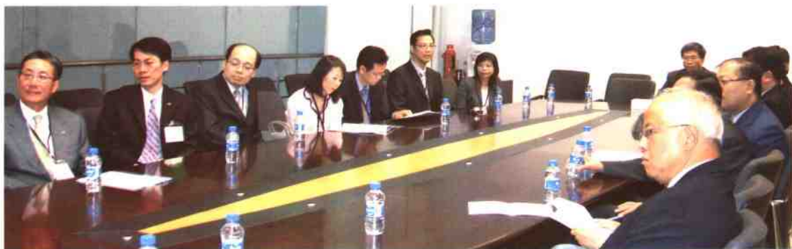
▲香港特别行政区图书馆委员会代表团访问深圳图书馆新馆并进行学术交流