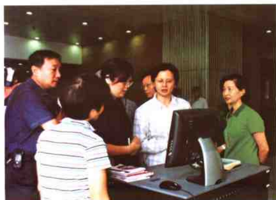
▲ 深圳市闫小培副市长来我馆视察工作并观看自助借还书操作过程