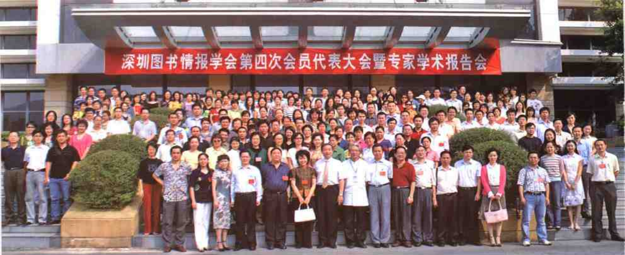
▲深圳图书情报学会会员参加“第四次会员代表大会暨专家学术报告会”合影