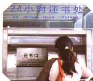
▶基于RFID的24小时自助还书系统