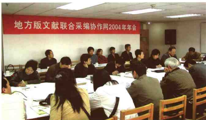
◀由深圳图书馆牵头发起和建立的“地方版文献联合采编协作网(CRLnet)”项目荣获首届文化部创新奖。图为2004年度CRLnet年会会场