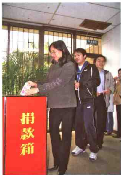
▲在历次支援灾区奉献爱心活动中，深圳图书馆职工积极捐款捐物，图为员工捐款场面