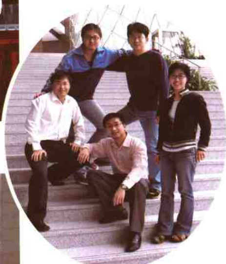
▲深圳图书馆共青团总支成员