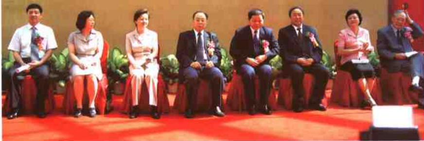
◀ 文化部周和平副部长、广东省雷于蓝副省长、深圳市许宗衡市长等领导出席新馆开馆典礼仪式