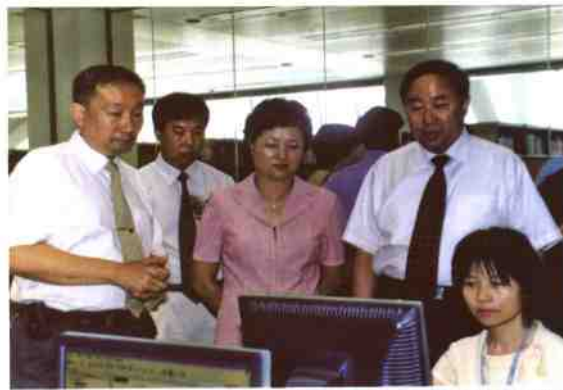
▲ 文化部周和平副部长、广东省雷于蓝副省长、国家图书馆詹福瑞馆长等领导观看dILAS现场演示