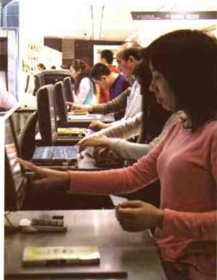
▲读者在使用自助借还书机借还图书