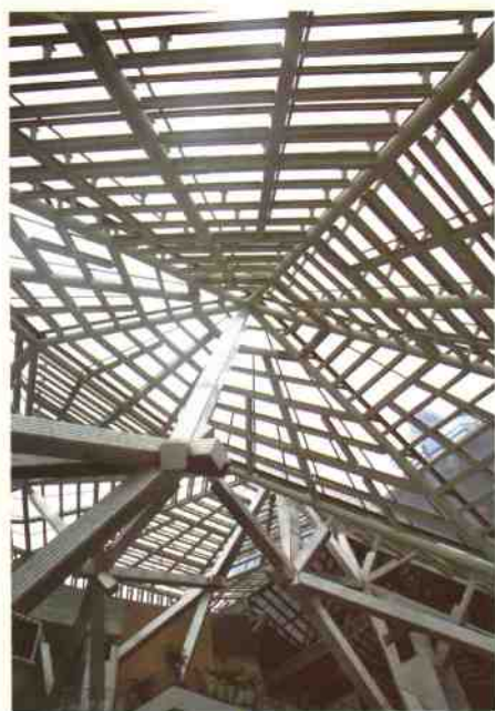
▲大厅“银树”熠熠生辉