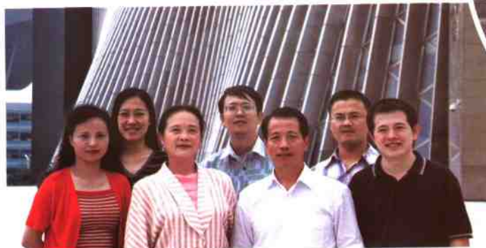
▲深圳图书馆工会成员