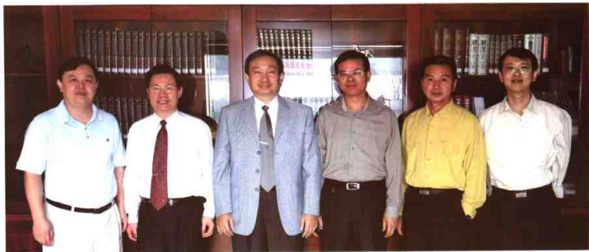
▲深圳图书馆党委成员