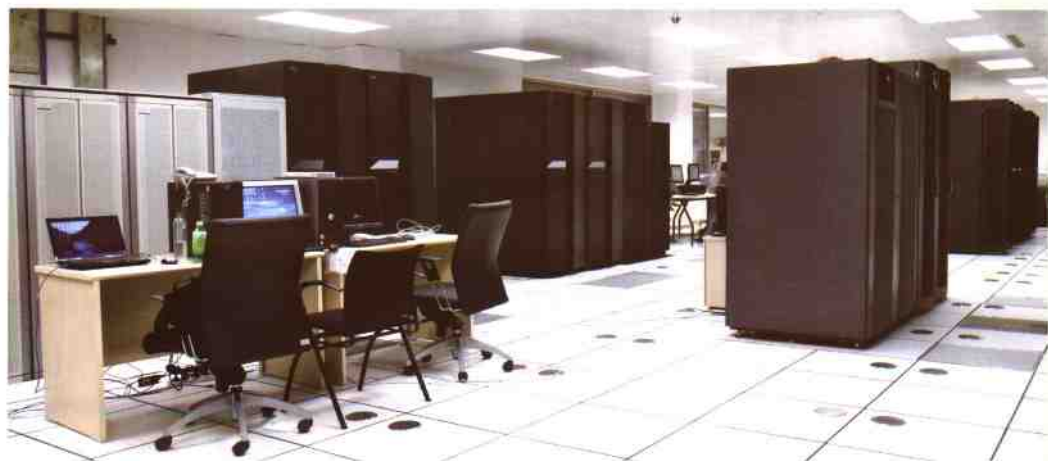
▲深圳图书馆计算机网络中心机房一瞥