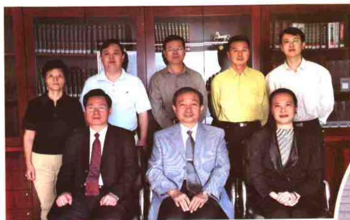
▲深圳图书馆领导班子成员