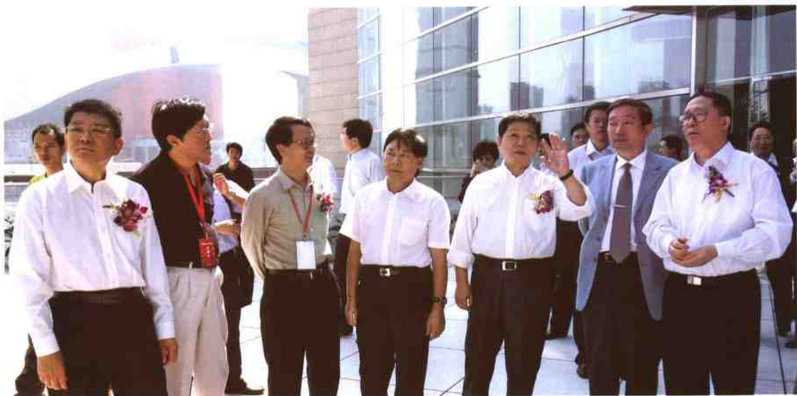
▲ 深圳市委书记李鸿忠、市长许宗衡、副书记李意珍、宣传部长王京生等领导在文化局陈威局长陪同下视察我馆