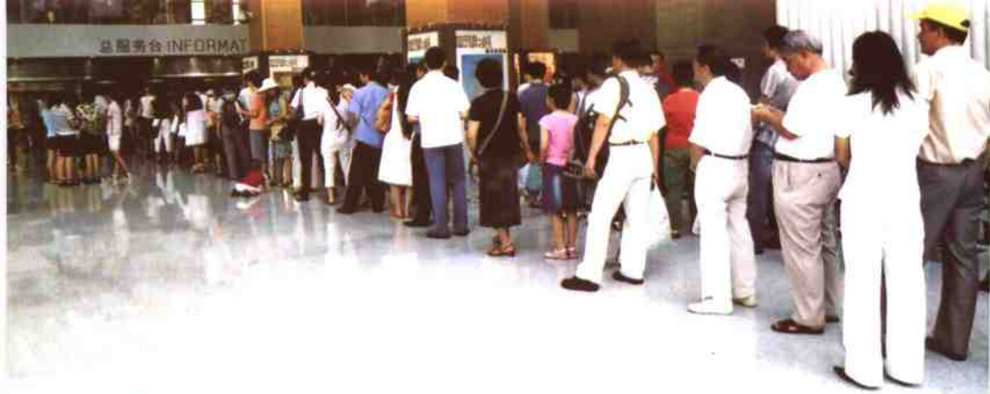
▲新馆开馆时读者踊跃排队办理借书证场面