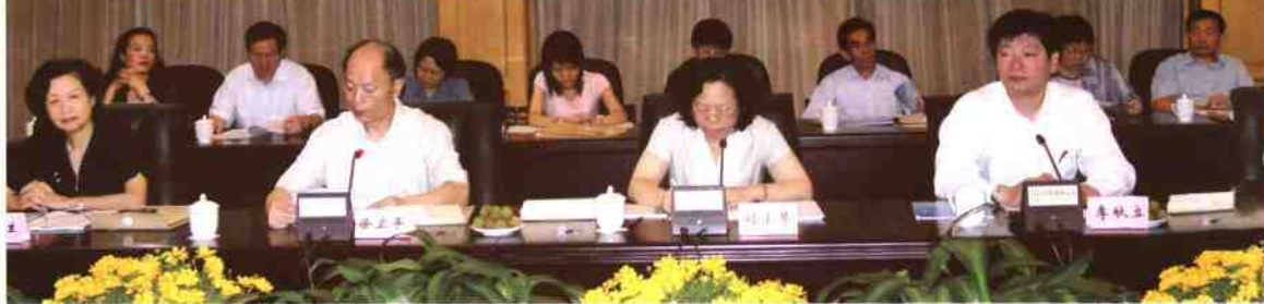
▲由深圳图书馆承担的国家重点科研项目——“数字图书馆体系结构研究与应用平台开发(dILAS)”通过技术鉴定。图为dILAS技术鉴定会会场