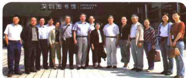
▲台湾地区图书馆专家和同行访问深圳图书馆新馆时合影留念