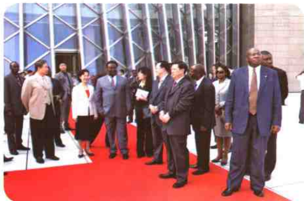
▲安哥拉总理费尔南多·多斯桑托斯先生到深圳图书馆访问