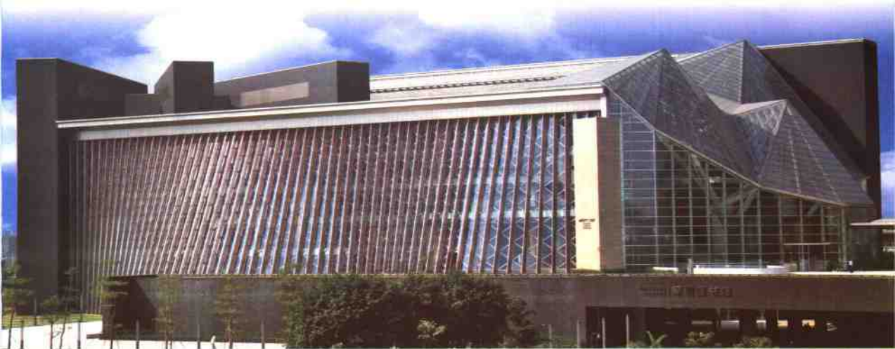
▲深圳图书馆新馆外景