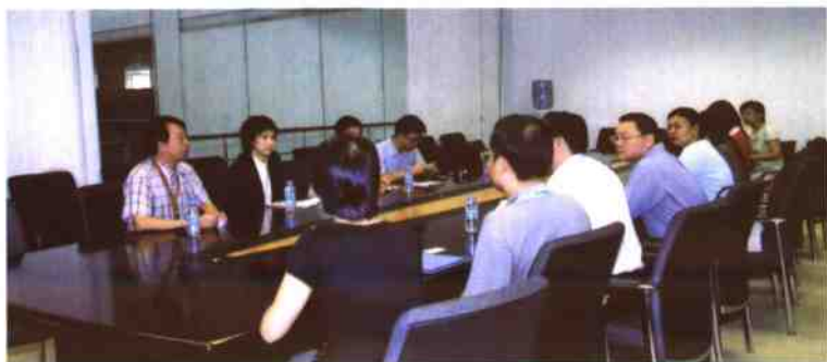
◀澳门图书馆暨资讯管理协会一行到深圳图书馆参观并进行学术交流