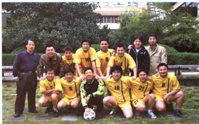
▲由深圳图书馆青年职工组建的业余足球队