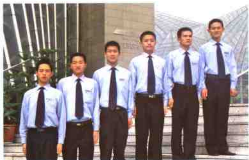
▲社会化的物业保安服务队伍