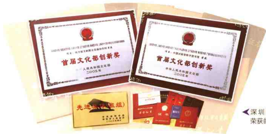
◀深圳图书馆近几年荣获的部分奖励证书