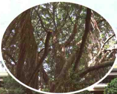
▲二十年，深圳图书馆老馆前的榕树已参天