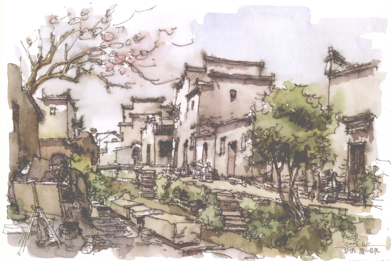
安徽写生·钢笔水彩

手绘表现图注重想象力和创造性，并以绘画的形式进行表述。画面中的构图、光影和色调等构成了基本内容，运用绘画的审美规律、原理，直接诉诸于视觉形象，突出形象自身的直接性和感染力。它同一般绘画有很多相似之处，都具有表达视觉及心灵感受的一面。但也有其自身的特点和规律性，有许多工程设计本身的要求和制约，如尺寸、形状、色彩等限制。画面更多强调的是形似而非神似，诸多元素具有一定的符号性。可以说手绘表现图是绘画艺术中一种特殊的表现方式，具有和绘画艺术相区别的独特的审美特征。