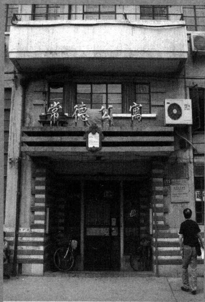
常德公寓，原名Edinburgh House，是张爱玲和她的姑姑住得最久的公寓，张爱玲的重要作品几乎都在这里写成，包括小说集《传奇》及散文集《流言》等等。

是主妇经常活动的地方……弄堂的房子即是一排一排的，每排相隔之间的通道也叫“弄堂”，一般弄堂不会很宽，住在房子里任何房间的人，从窗口望出去，必须仰头到四十五度角才能看见天空。第二天一觉醒来，首先听到的是整个弄堂里不调和的合奏乐。其中之一是上海弄堂特有的竹刷子洗马桶的声音。上海那时虽有东方巴黎之称，但绝大多数的弄堂房子还没有水厕的设备。晚上各家把马桶排列在家门口，大清早有粪车来掏去，主妇们就把空桶洗刷干净，竹条制成的刷