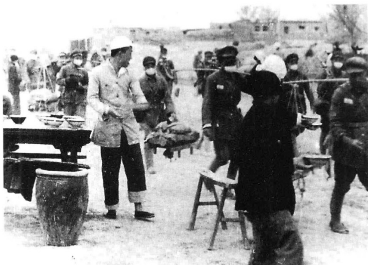
安阳人民群众积极支前