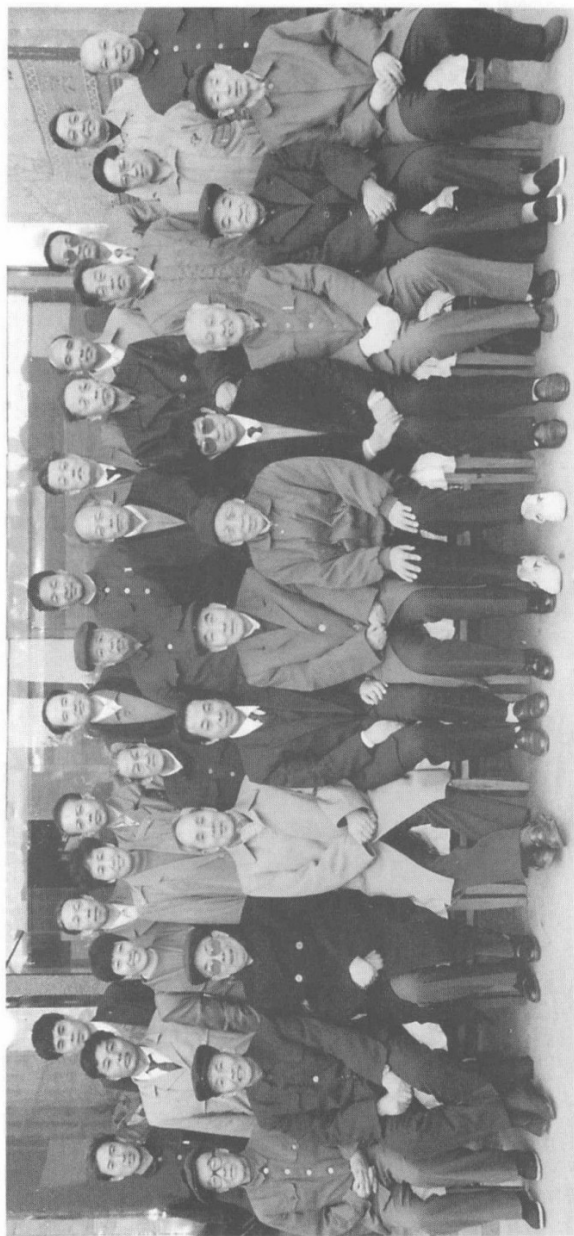
1995年11月20日《中共安阳县党史》审定会合影