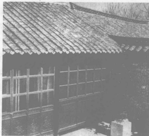
江苏省淮安市周恩来故居

周恩来虽然出生在一个封建官宦家庭，但到他的父辈已经衰落，家中的进益甚至不能维持生活。从六岁开始，他就随两位母亲一次又一次地搬迁漂泊，而且家中的变故也尤为剧烈。在九岁到十岁间，其生母和嗣母先后去世。幼小的他带着两个弟弟在族人的帮助和接济下度日，受了不少屈辱。周恩来说：“我从小就懂得生活艰难。父亲常外出，我十岁、