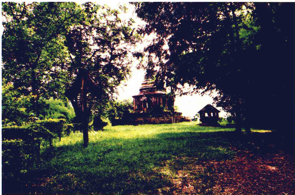
车里宣慰司署遗址

对普洱茶历史稍有了解的人都知道，清代是普洱茶走向鼎盛达到“名重天下”的时期，但清代的许多史籍在记载普洱茶时却异书同语，几乎都是“普洱茶产自六大茶山”，六大茶山即今西双版纳州澜沧江东岸的勐腊县及景洪市境内的倚邦、易武、莽枝、革登、蛮砖、攸乐六茶山，在清代的史书中说普洱茶必说这六座茶山。为什么清代的史书总是说普洱茶产自六大茶山，普洱茶与六大茶山到底有什么关系，六大茶山在普洱茶历史上产生过什么影响，担当过什么角色？贡茶为何会在六大茶山采收？云南的老茶庄、老茶号为何最早都集中在六大茶山？普洱府没有成立之前六大茶山与普洱茶又是由哪个地方政权管理？