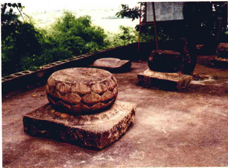
车里宣慰司司署遗址留下的石墩

要弄清这些问题，我们的目光要移向明清时期的西双版纳即车里宣慰司，更需要解读清雍正年间那场震撼南疆的政治改革和经济改革运动——改土归流。改土归流改写了云南的历史，改变了车里宣慰司，改土归流催生了流官政权普洱府，改土归流让六大茶山成为普洱茶一百多年中盛衰起伏的大展台。