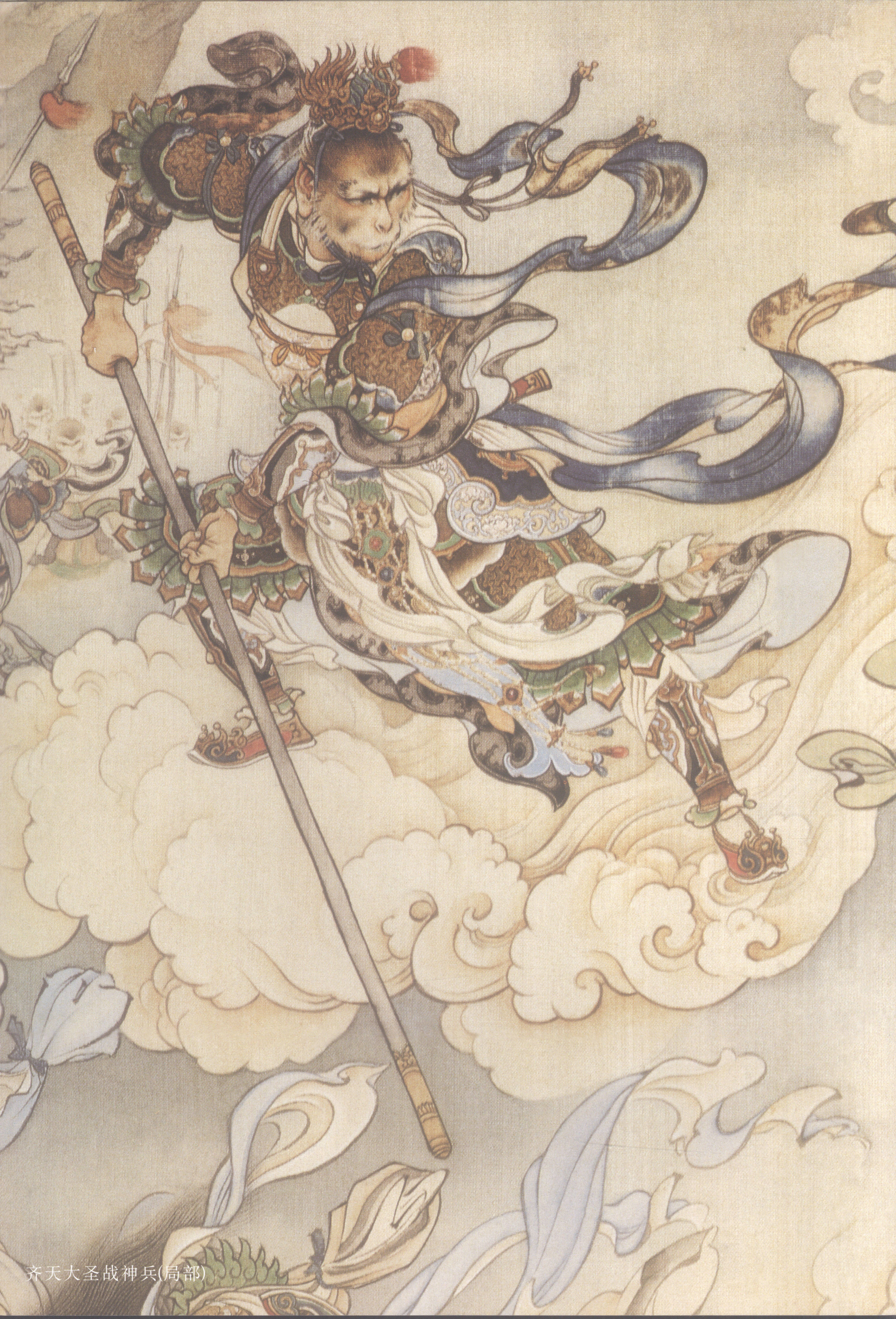
齐天大圣战神兵(局部)