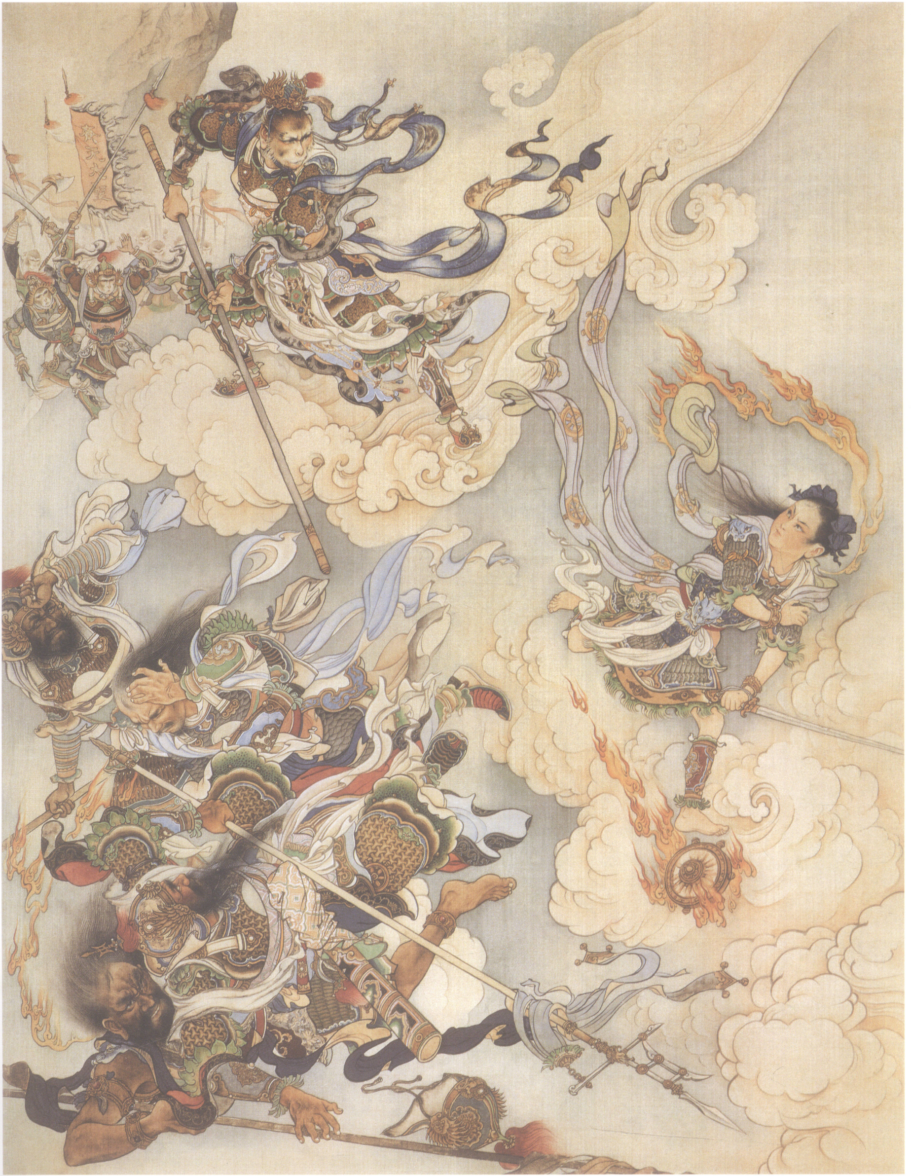
三、齐天大圣战神兵