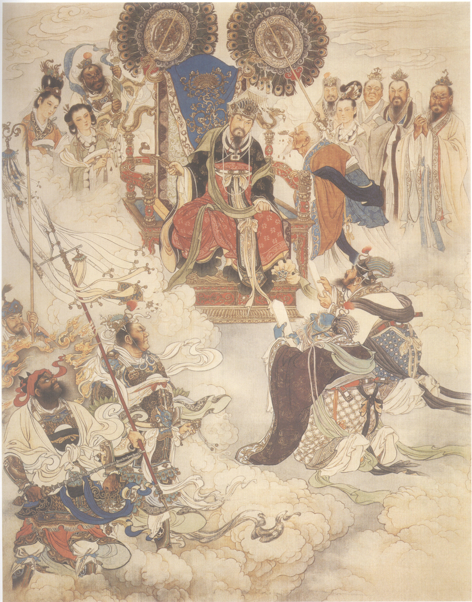
一、降石猴稟议天庭