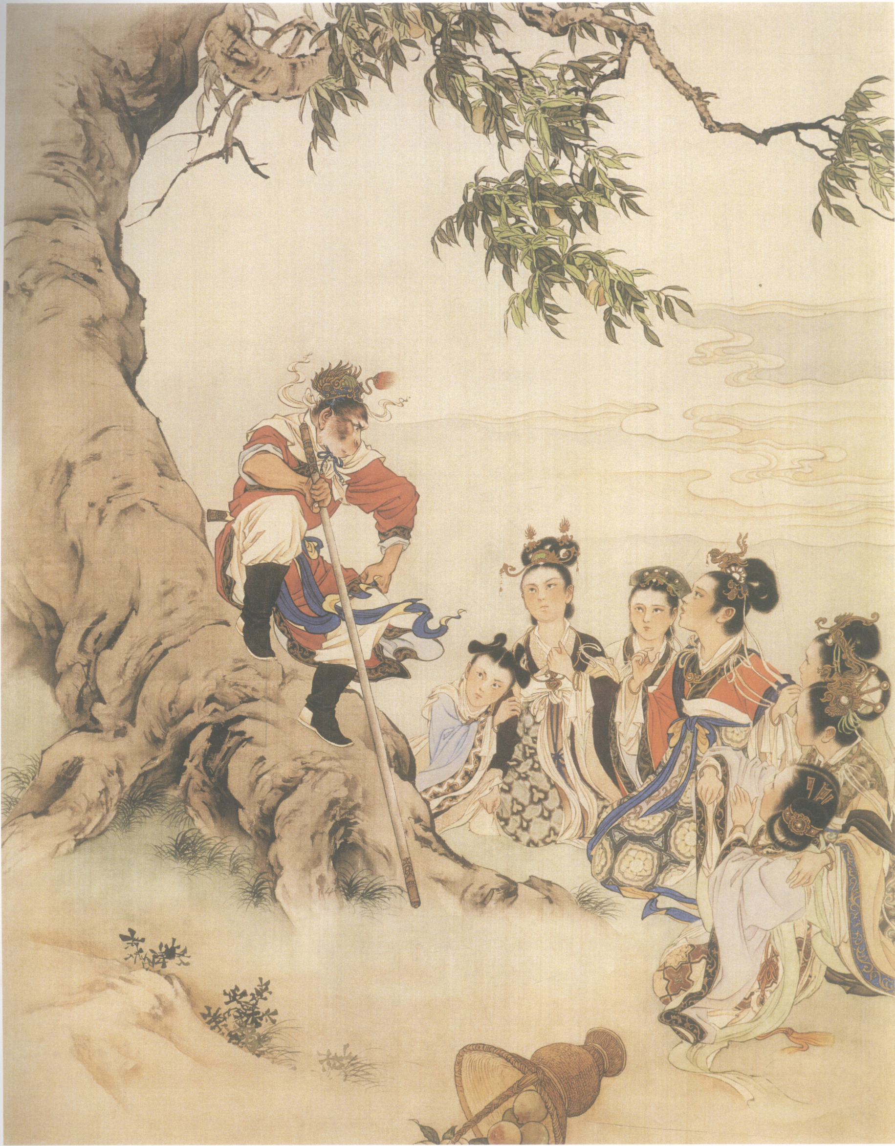
四、蟠桃园内问真情