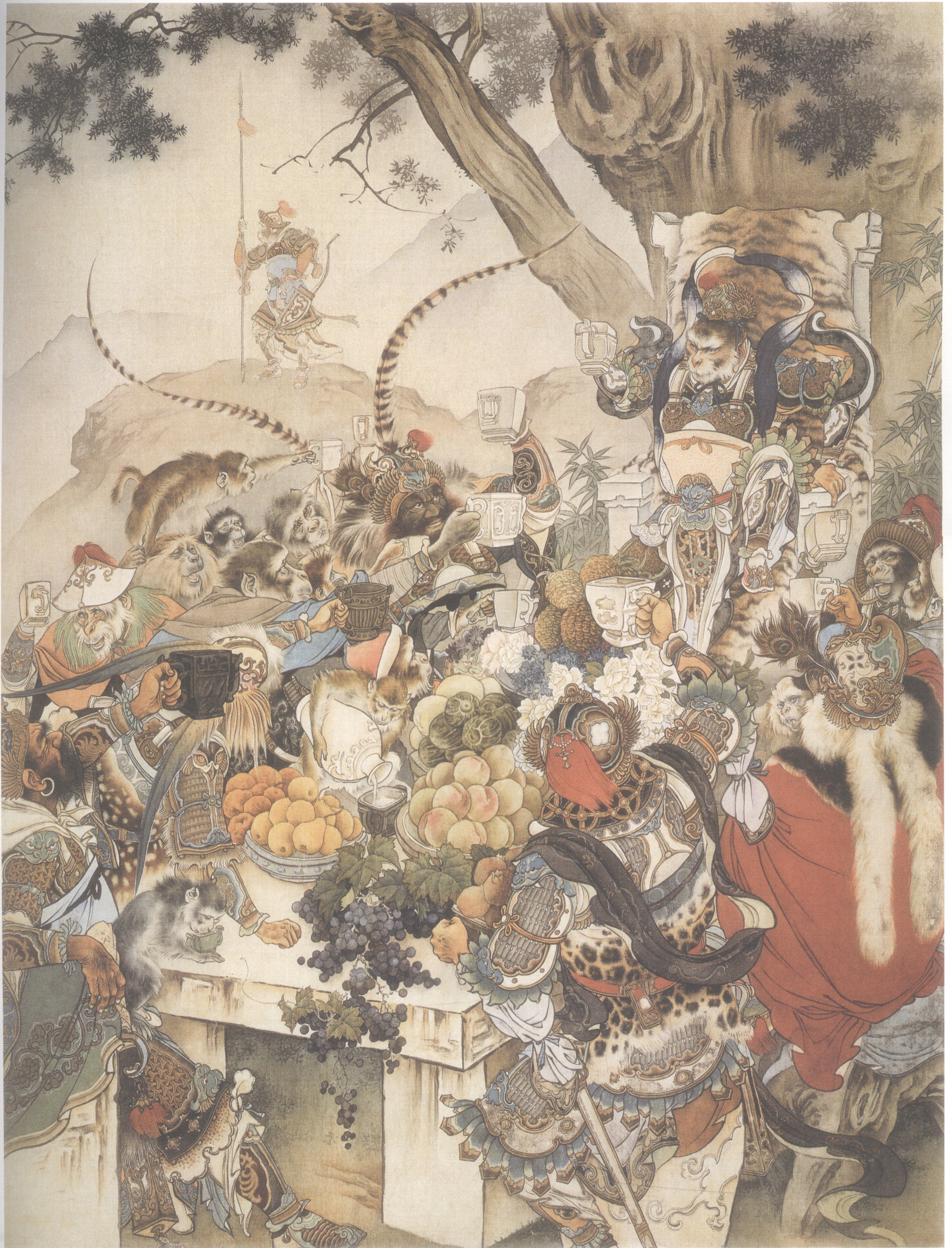
六、下界为王会亲朋