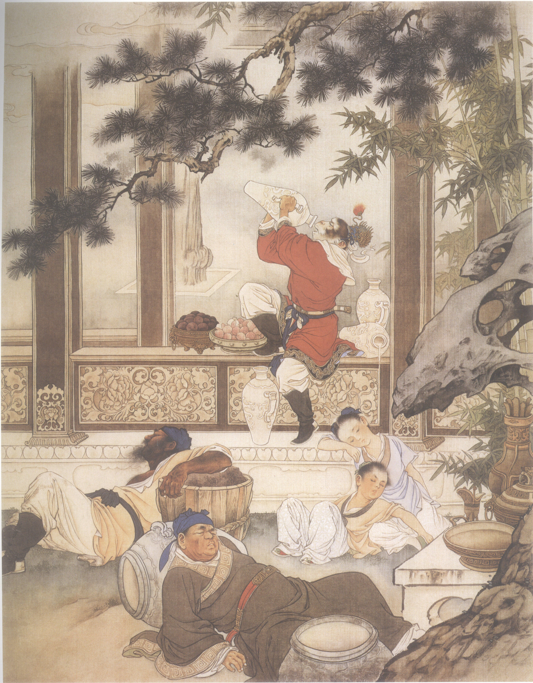
五、醉罢瑶池食仙丹