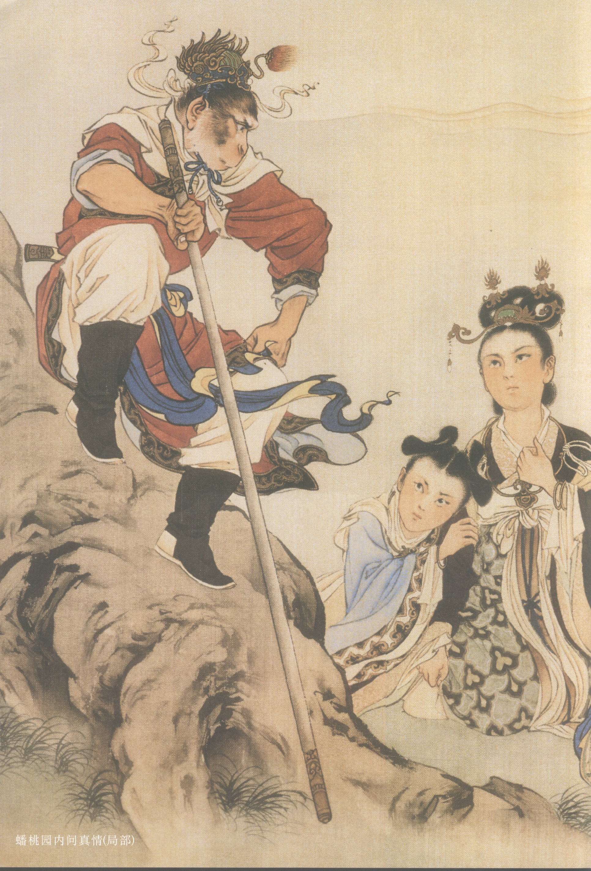
蟠桃园内问真情(局部)