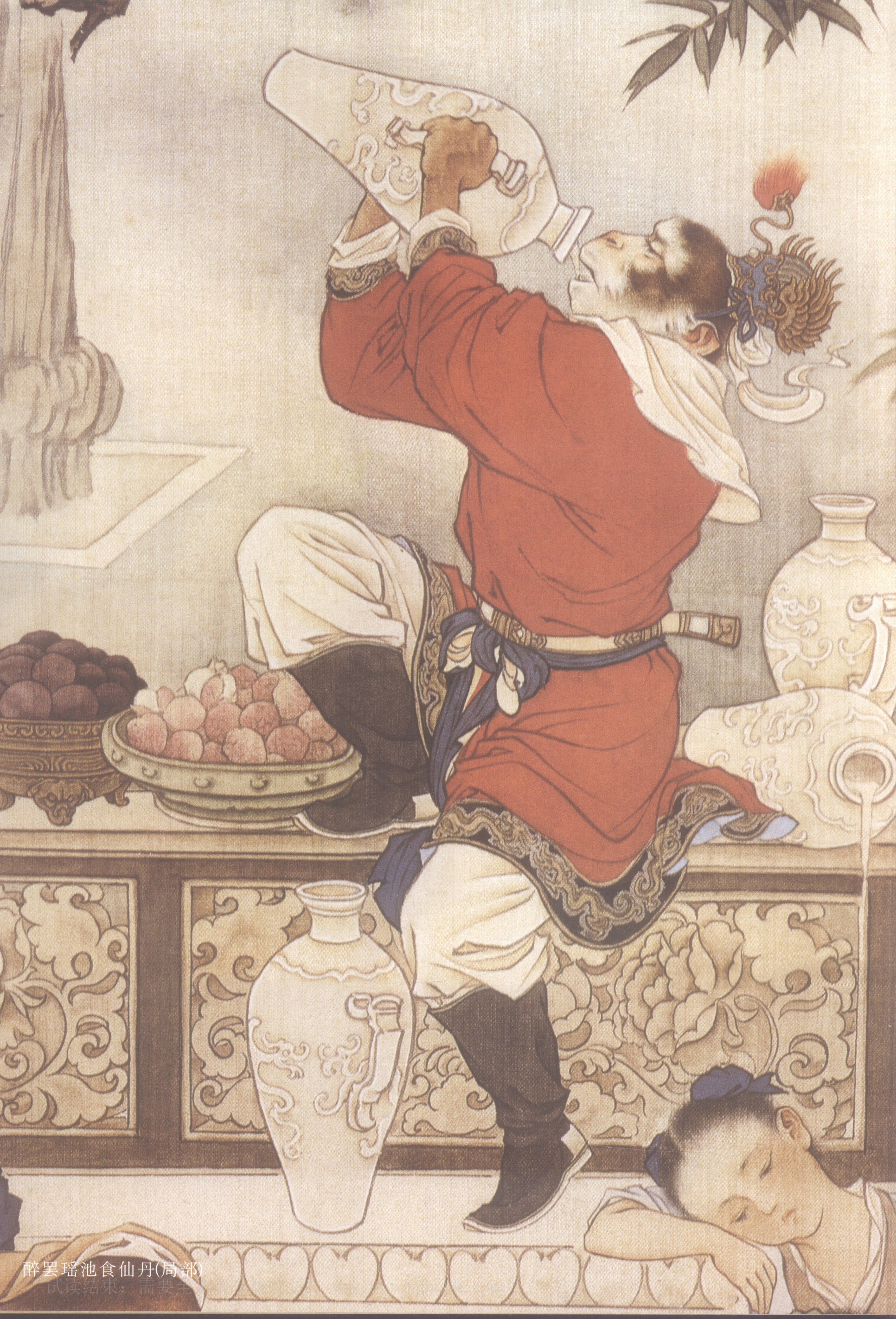
醉罢瑶池食仙丹(局部)