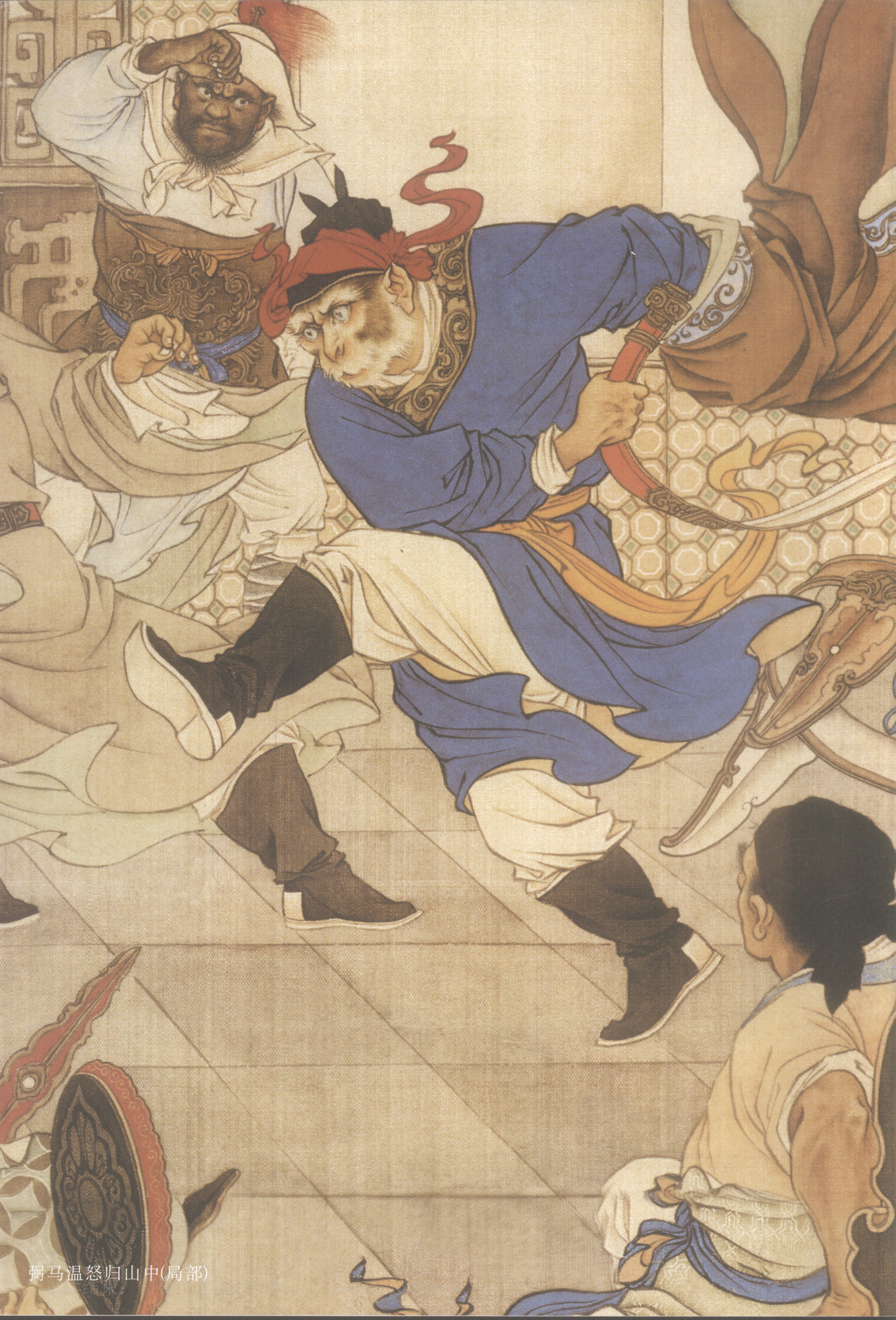
弼马温怒归山中(局部)