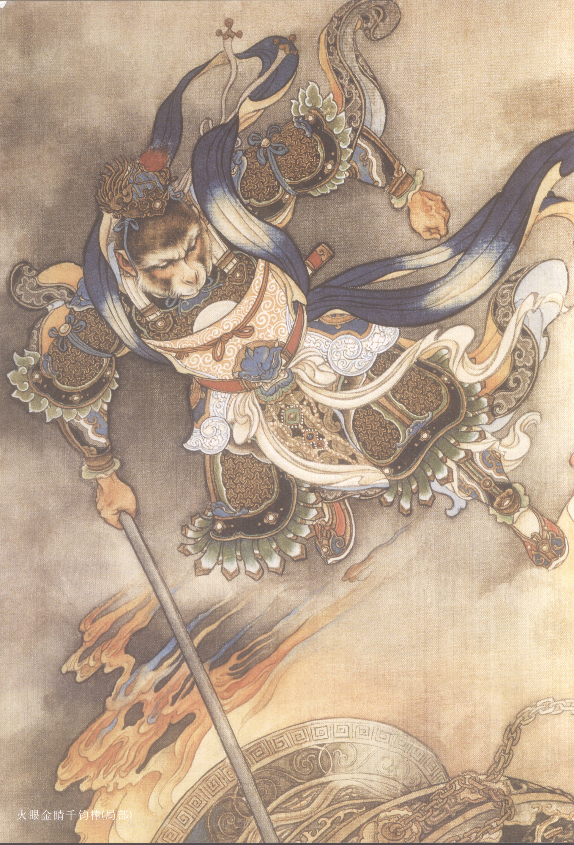
火眼金睛千钧棒(局部)