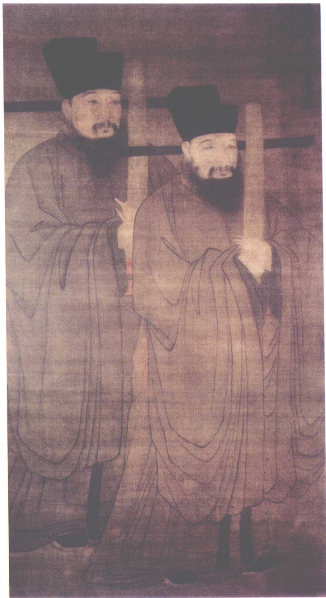
范文正公與次子忠宣公（純仁）像