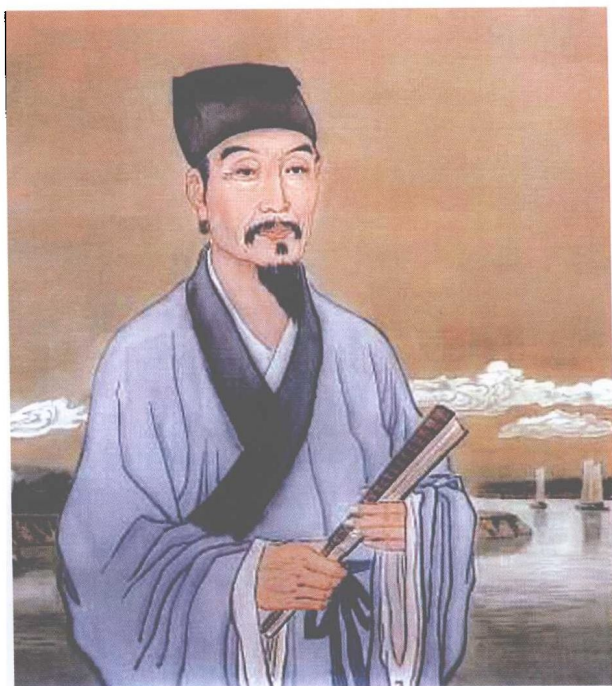
吴承恩像(丁迺武作)