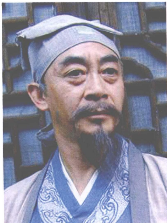
既演吴承恩,又演孙悟空 (大型传奇神话立体电视剧《吴承恩与〈西游记〉》)