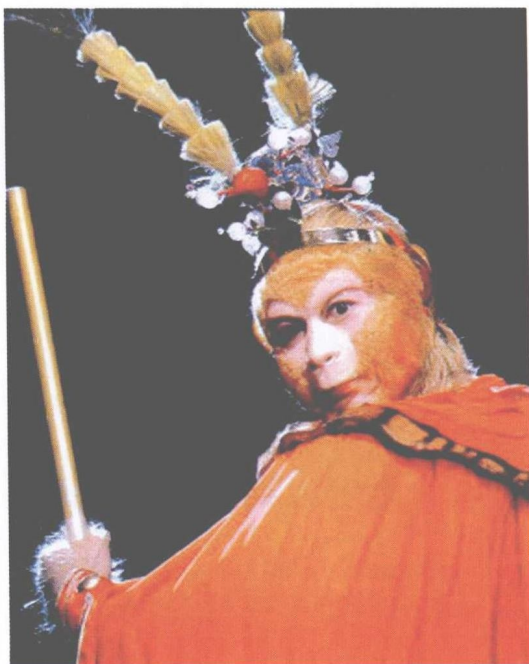
六小龄童版孙悟空(电视连续剧《西游记》)