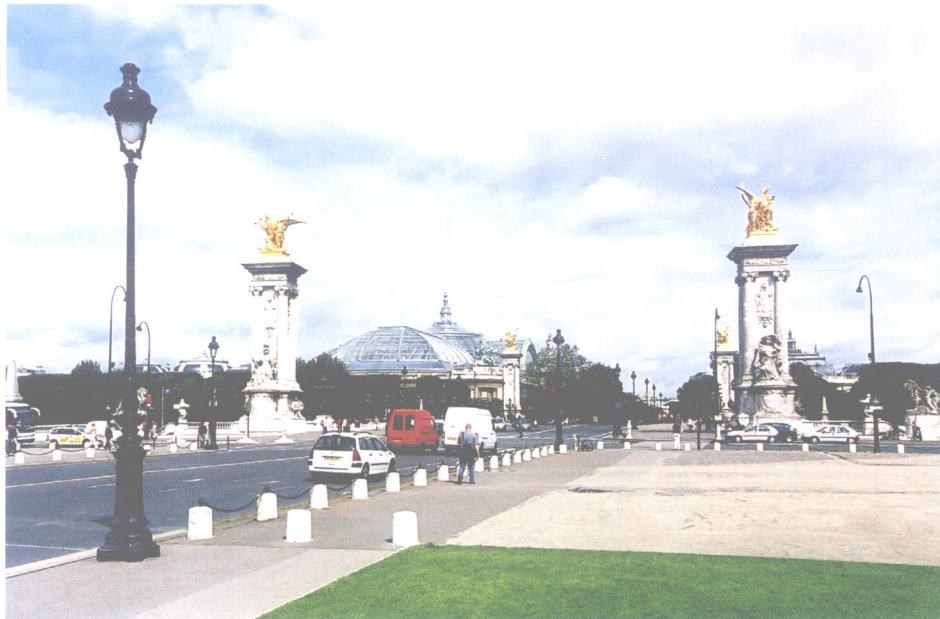
巴黎亚历山大桥(法国)