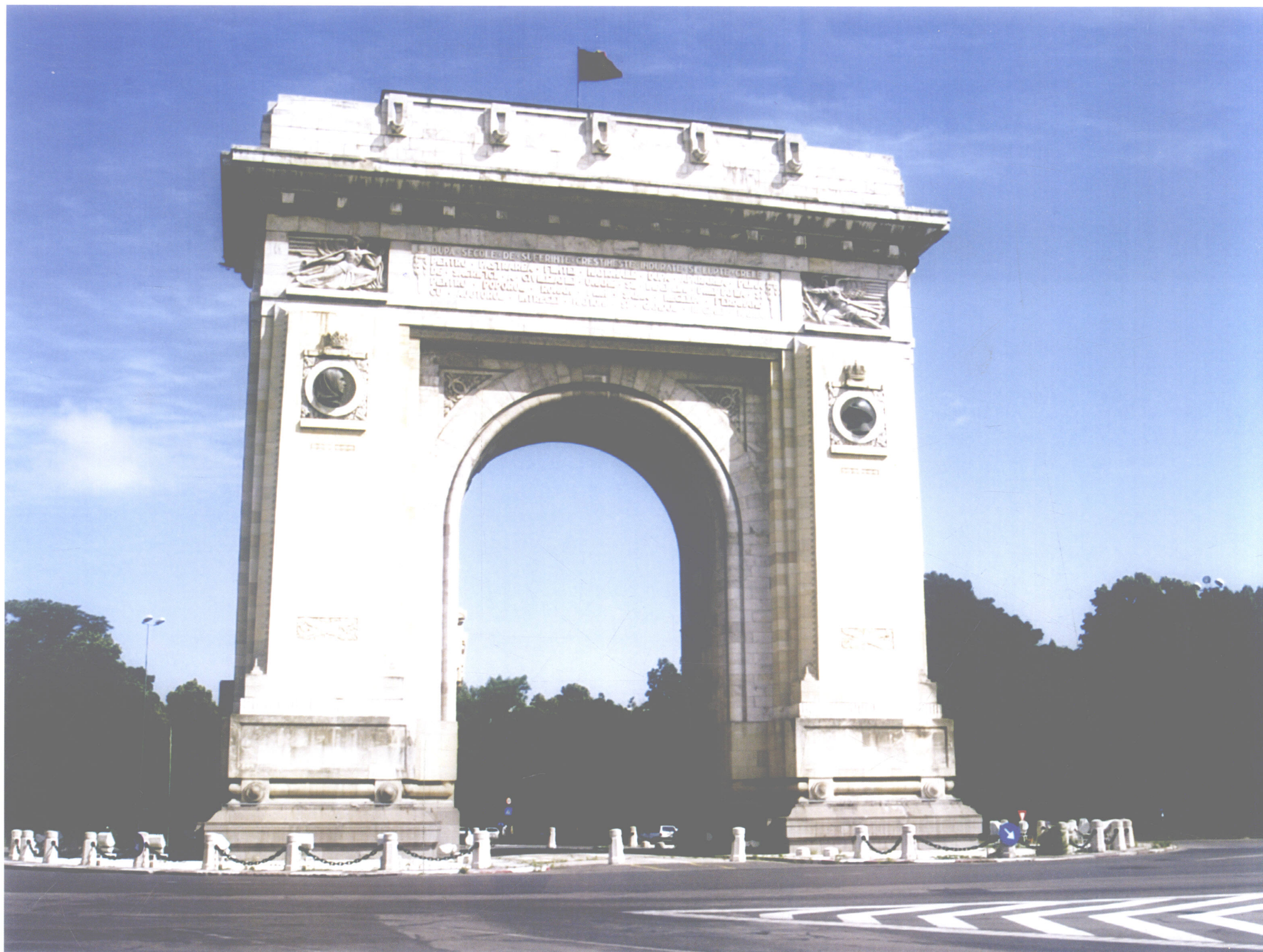
布加勒斯特凯旋门（罗马尼亚）