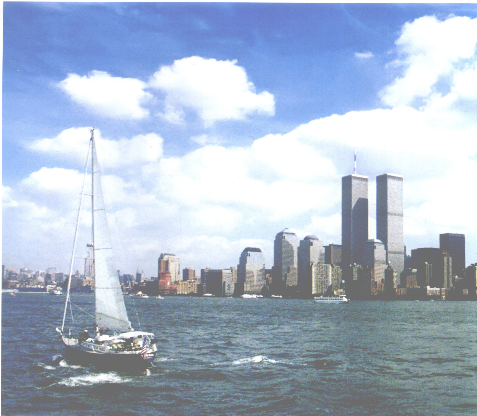
曼哈顿远眺——失去的记忆