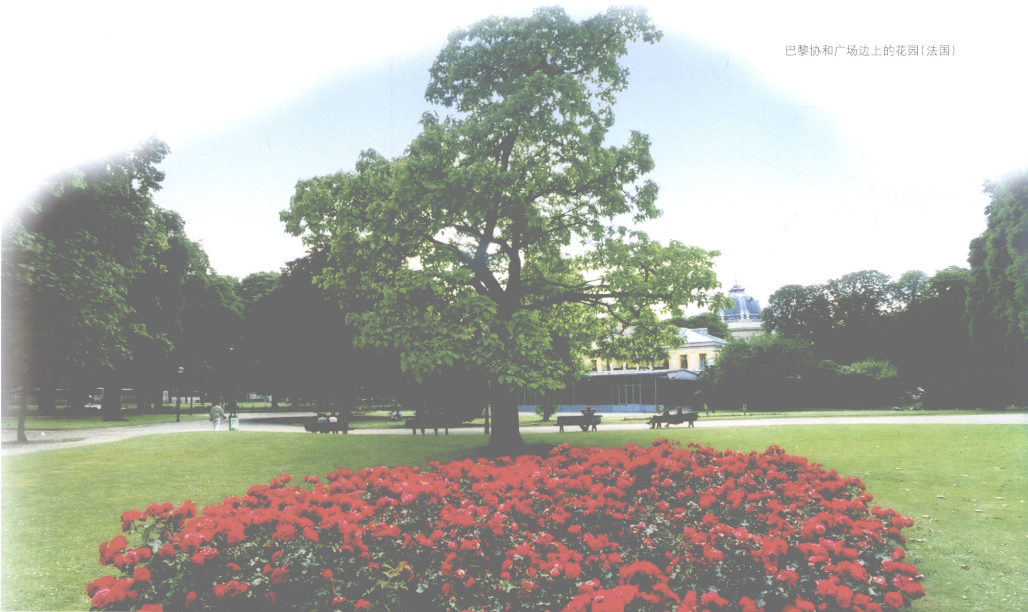
巴黎协和广场边上的花园(法国)