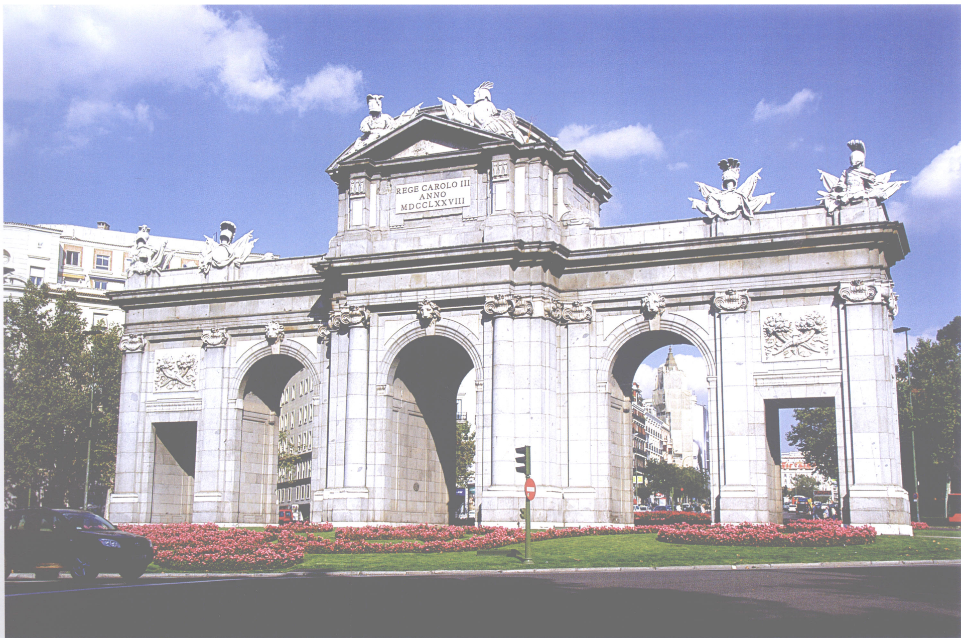
马德里阿尔卡拉之门(西班牙)