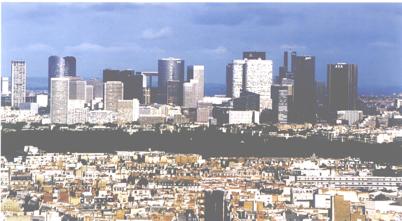
巴黎新区拉蒂芳斯远眺