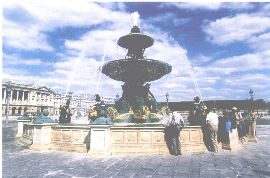
巴黎协和广场的喷泉(法国)