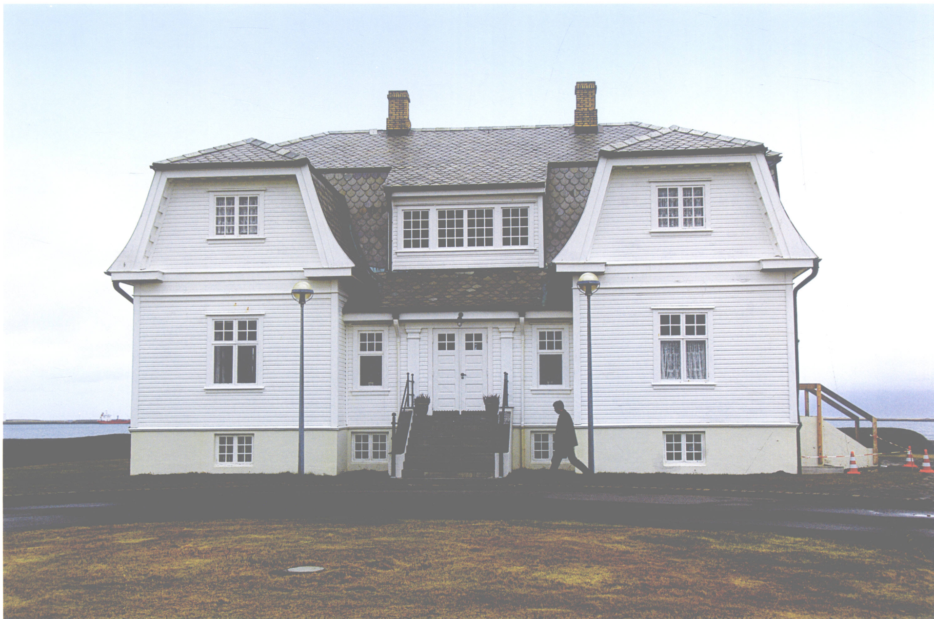
鬼屋(冰岛 雷科亚维克)

1986年美国总统里根和苏联首脑戈尔巴乔夫在此签署了两国核裁军协议，从而结束了冷战。