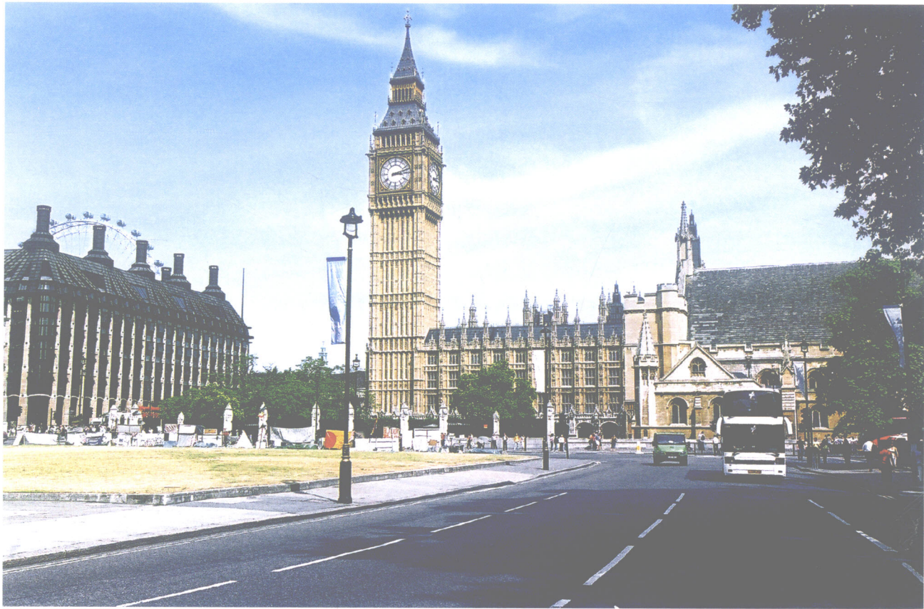
伦敦议会大厦 (英国)