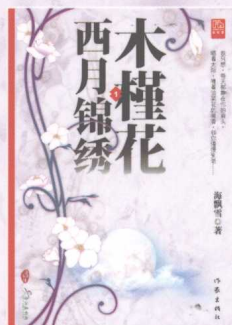
《木槿花西月锦绣》1、2 海飘雪◎著