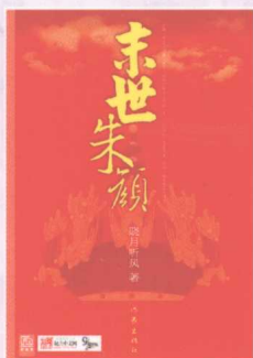
《末世朱颜》 晓月听风◎著