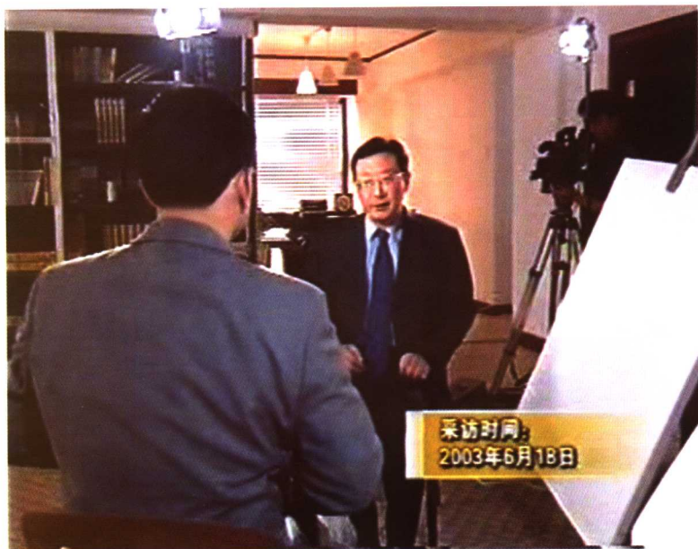
2003年，中央电视台《面对面》栏目专访