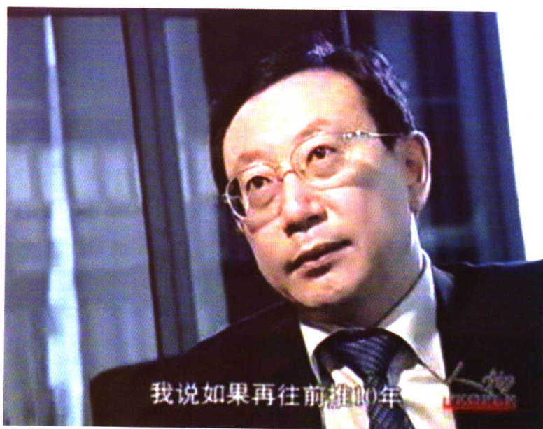
2004年中央电视台《人物》栏目专访