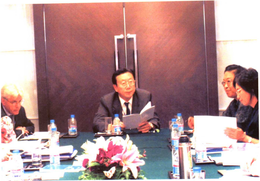
2006年6月9日 中加人权与司法圆桌会议