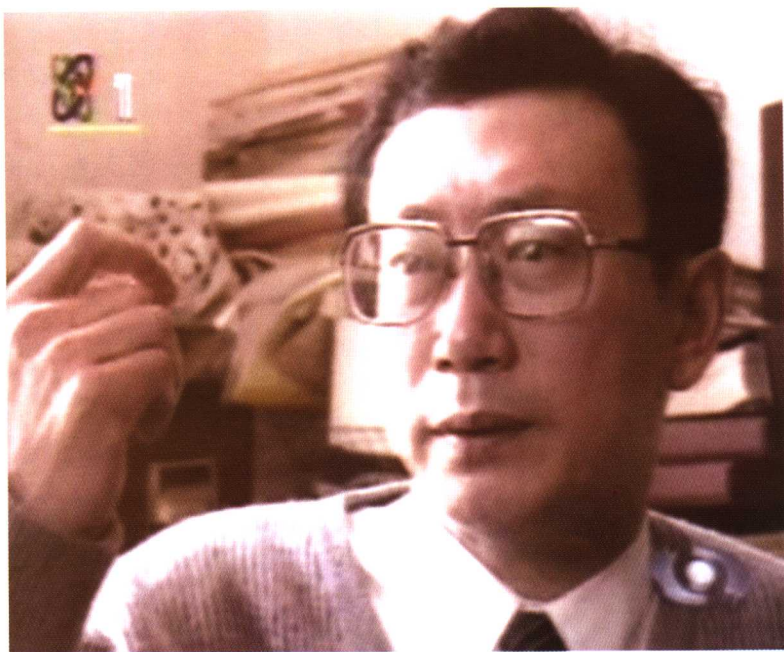
1996年中央电视台《东方之子》栏目专访