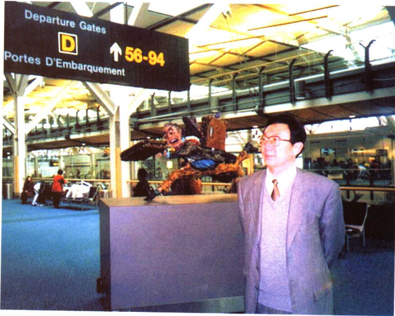
人权对话 加拿大 温尼伯克机场