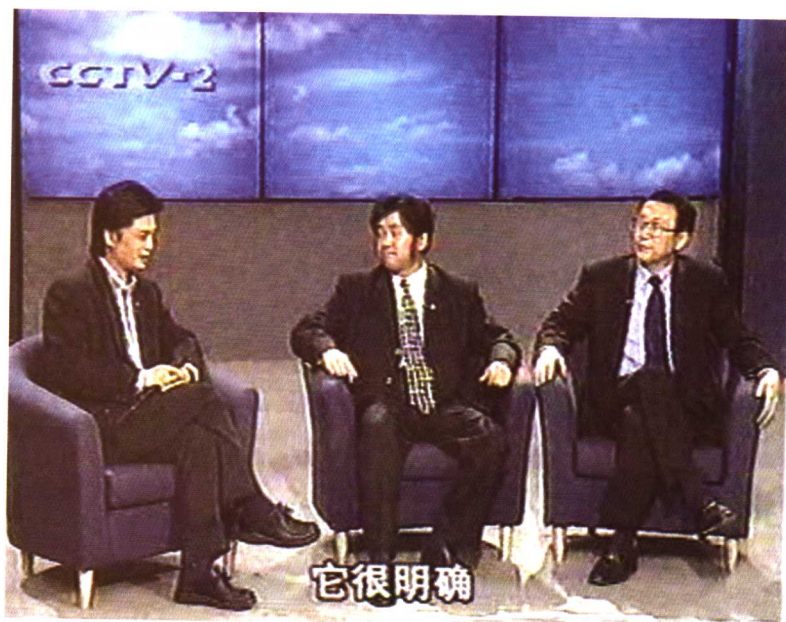
1996年中央电视台《实话实说》