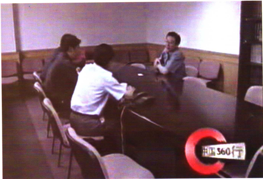
2001年中国教育电视台《中国360行》栏目专访