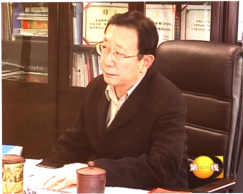
2005年中央电视台《第一线》专题节目《田文昌十年》