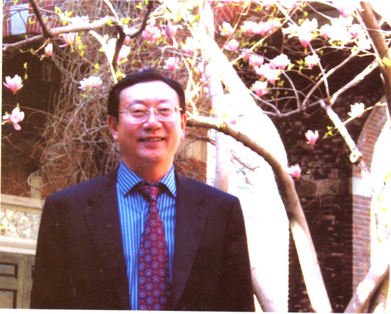
2006年初应美国纽约大学邀请出访美国