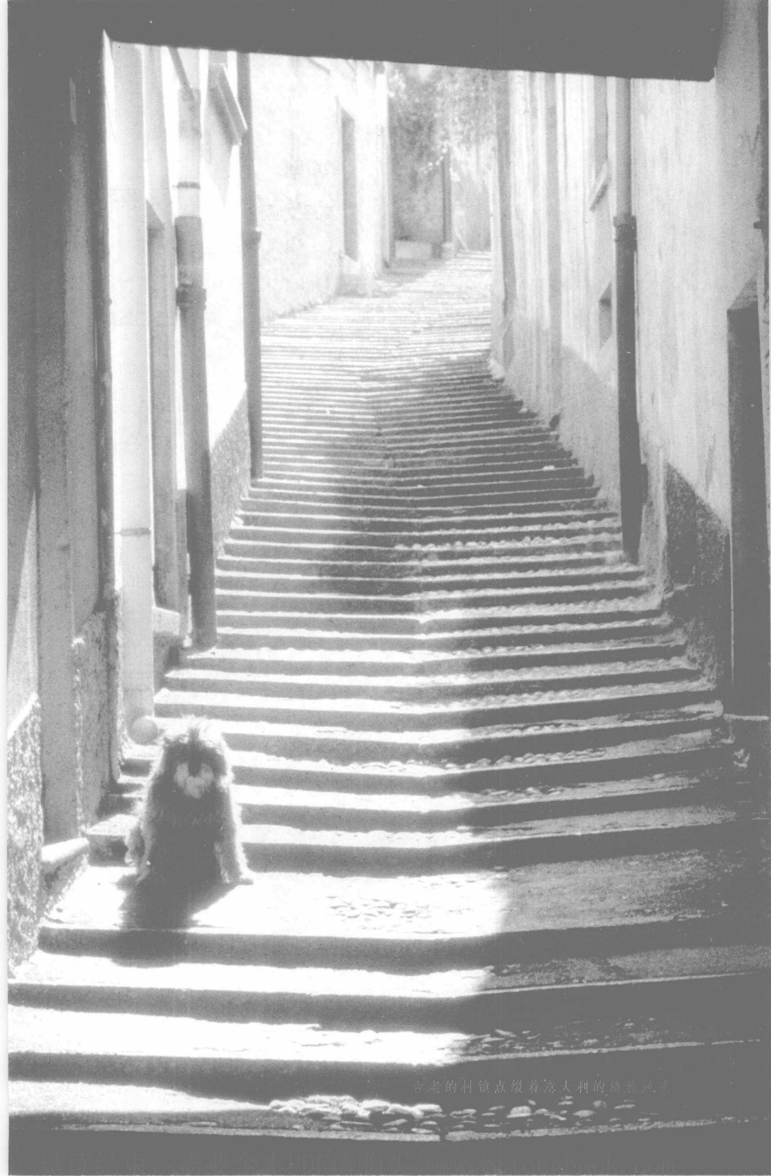
古老的村镇点缀着意大利的旖旎风光。