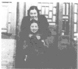
◎少女时代的林海音（下方）

林海音（1918—2001），原名林含英，小名英子，原籍台湾省苗栗县。父母东渡日本经商时林海音出生，3岁返回台湾，当时台湾已被日本帝国主义侵占；5岁时全家迁居北京，小英子在北京长大，直到30岁。1948年8月，林海音同丈夫夏承楹带着三个孩子回到故乡台湾。