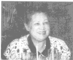
◎大家都叫她“林先生”