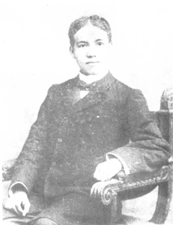
梁启超一九〇〇年摄于澳大利亚