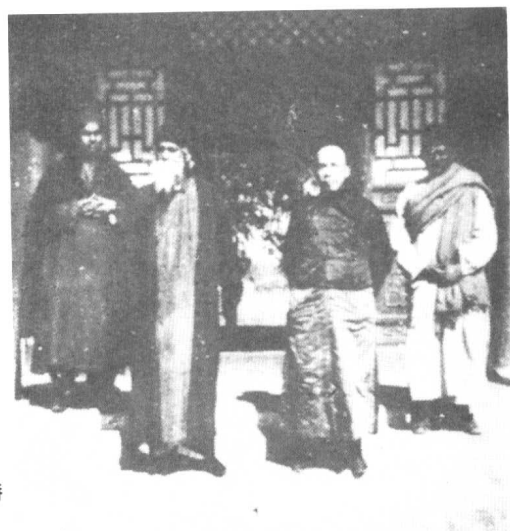
一九二四年梁启超与印度诗人泰戈尔合影