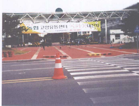
图 14 超市外景