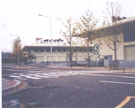
图6 中央批发市场一角