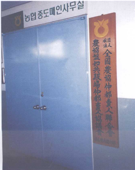
图13 驻中央批发市场中间商行业协会办事处