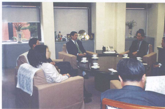
图2 课题成员拜会韩国 农村经济研究院院长