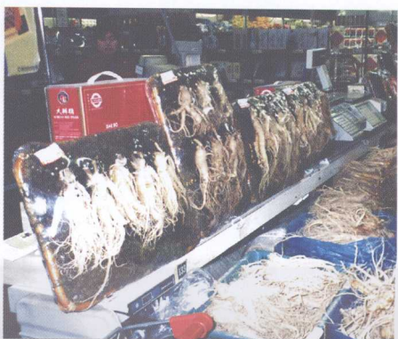
图 19 超市商品陈列