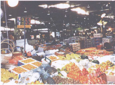
图11 中间批发商摊位