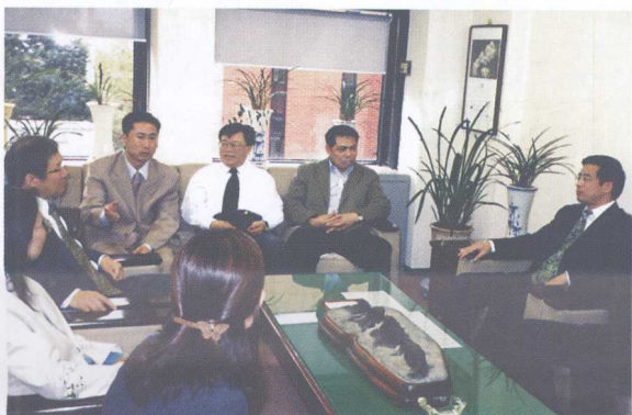
图3 中韩课题组成员 座谈交流