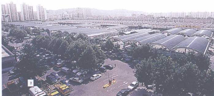
图4 可乐洞市场全景图