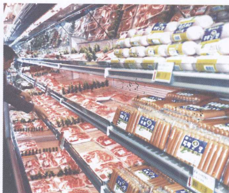
图 17 超市商品陈列