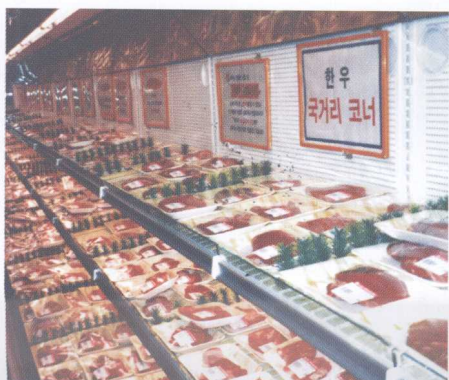
图 18 超市商品陈列