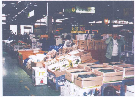
图12 中间批发商摊位