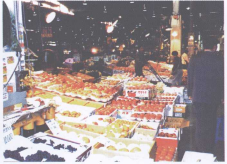
图10 中间批发商摊位