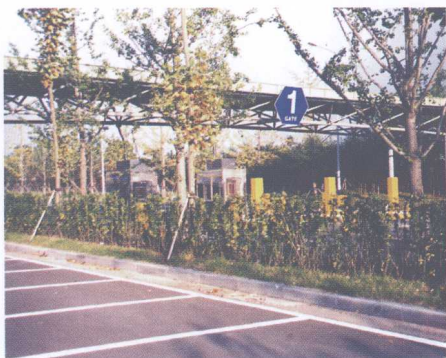
图5 中央批发市场自动进出口