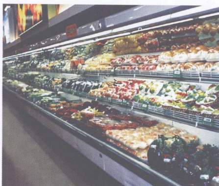
图 16 超市商品陈列