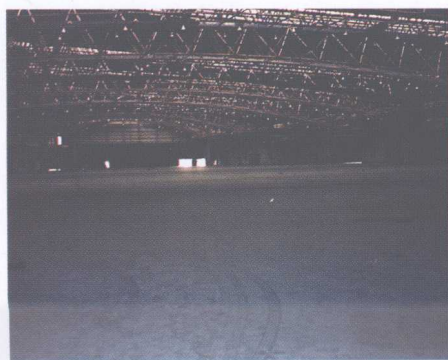
图7 新建江西中央批发市场交易大厅