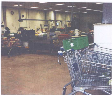
图 15 大型超市自设的分包装加工场