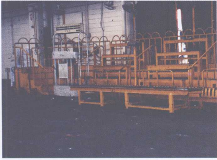
图9 可乐洞中央批发市场拍卖台