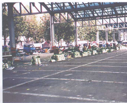
图8 可乐洞中央批发市场大白菜 专用交易场地