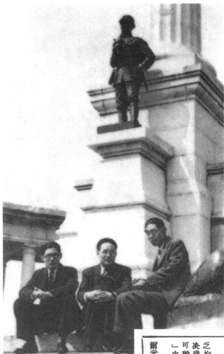
1938年在廣州。左起：夏衍、潘漢年、茅盾。