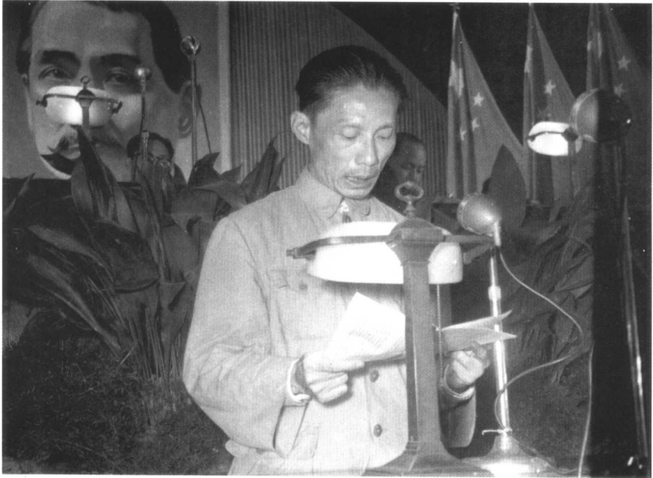
50年代初在上海作工作报告。