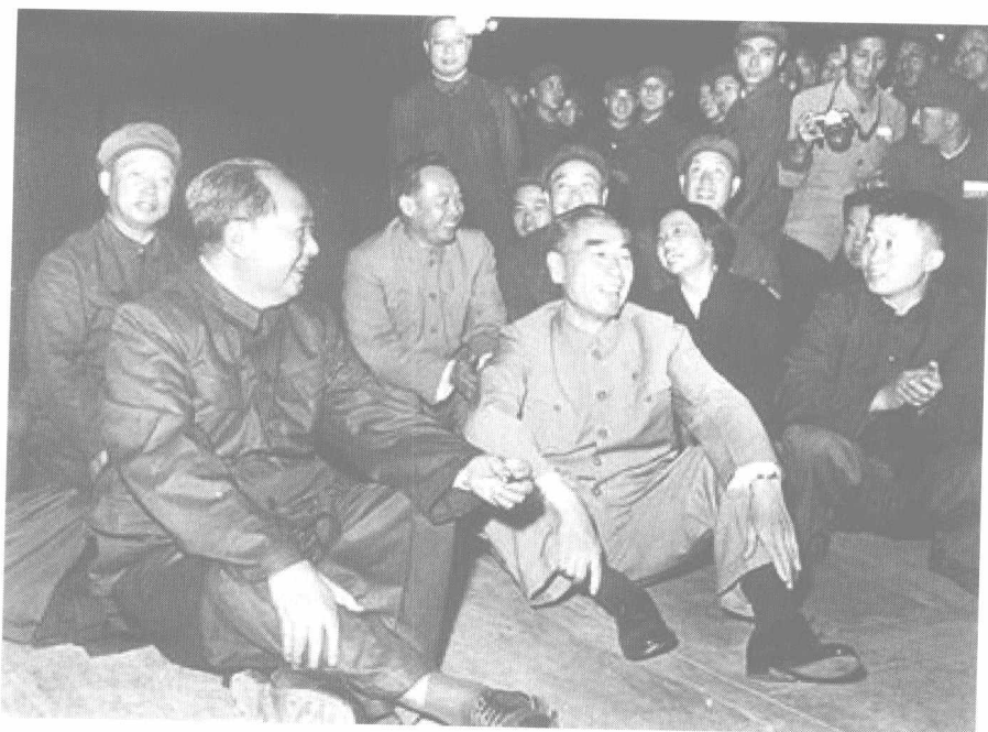
1966年国庆节,在天安门金水桥与群众共观焰火。