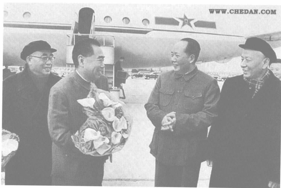
1964年11月，周恩来从苏联回国时在机场受到毛泽东的欢迎。