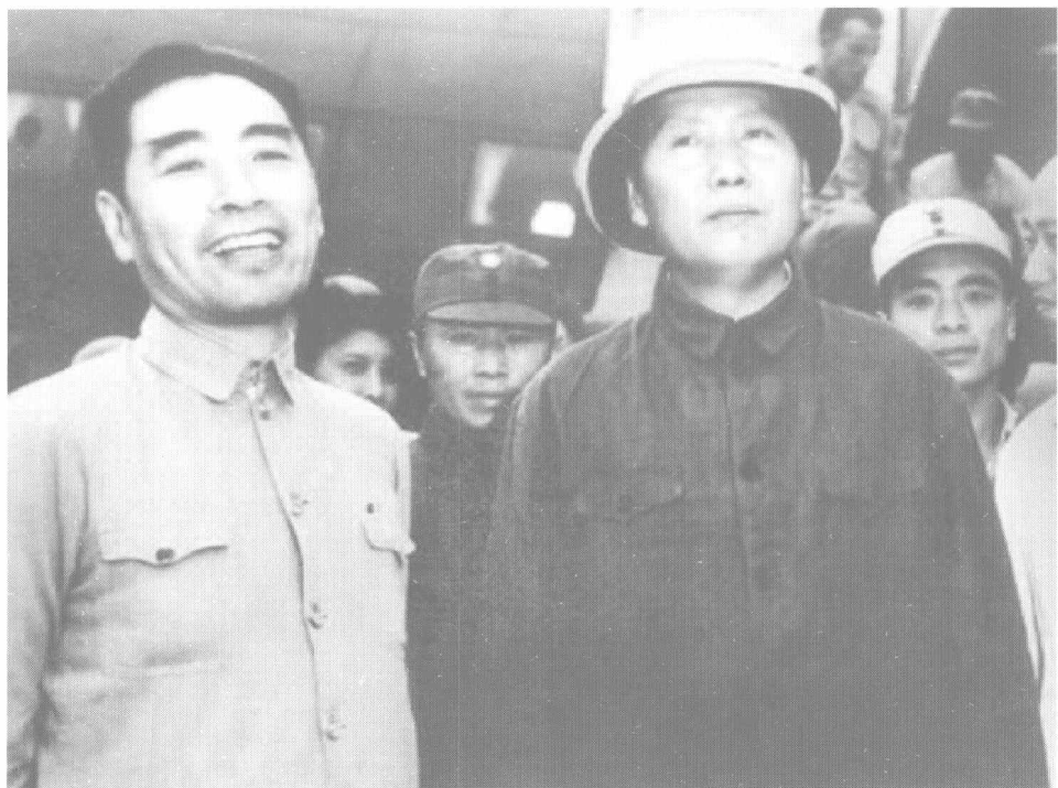
1945年8月，为谋求国内和平，周恩来陪同毛泽东到重庆同国民党谈判。