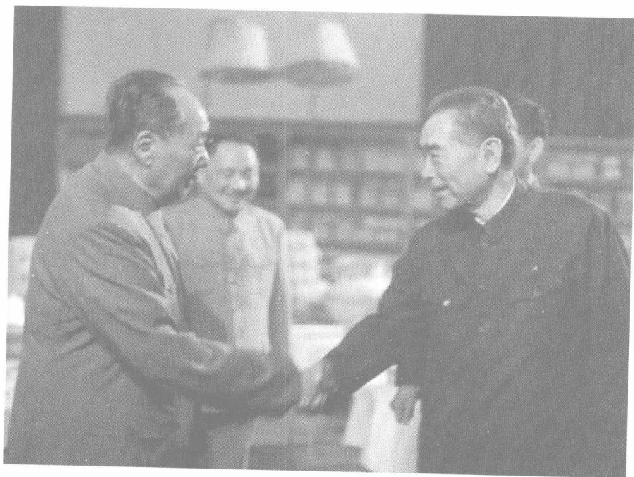
1974年5月,在中南海游泳池客厅。