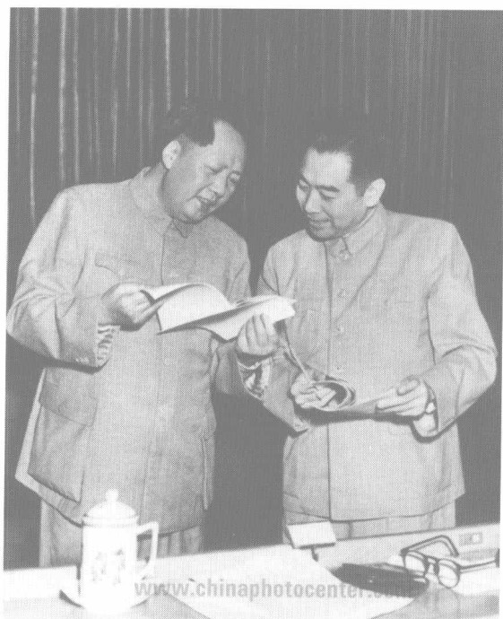
1953年，在中南海怀仁堂出席中央人民政府委员会会议。