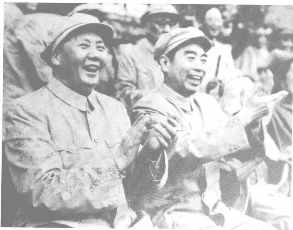
1952年8月,观看解放军体育运动大会。