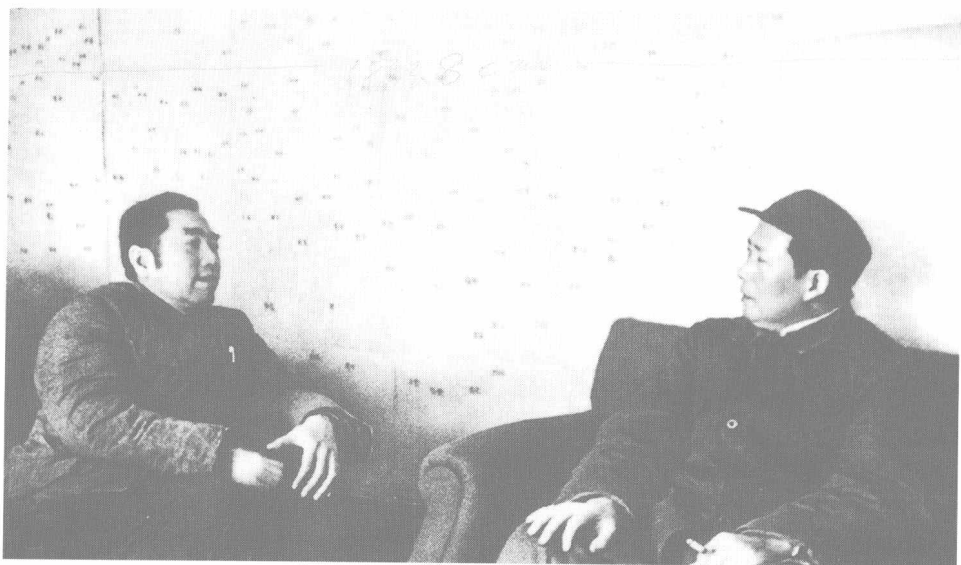
1948年5月,毛泽东与周恩来在西柏坡。