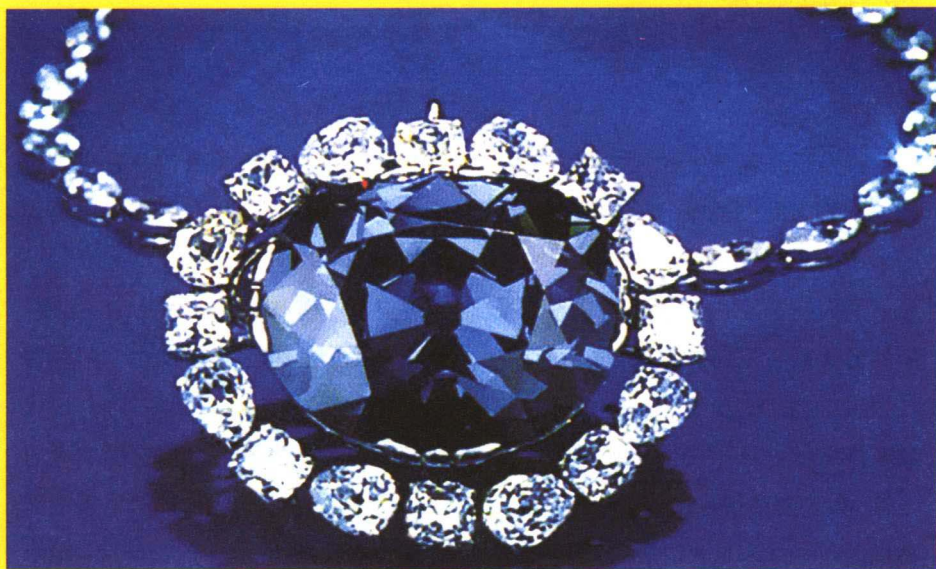
厄运缠身的“希望钻石”

赏赐，没有多久便给儿女们挥霍一空，风烛残年的塔维密尔不得不返回印度，最后被当地的野狗活活咬死。路易十四更倒霉，刚戴了一次“希望钻石”，就染上天花，死了……三百年，大钻石被倒来倒去，沾上就掉一层皮，直到20世纪60年代，珠宝商温斯顿把它赠给了华盛顿的“史密斯研究所”，“希望”的诅咒消失了，它从珠宝圈里跳出来，乖乖地做了一枚科研标本。