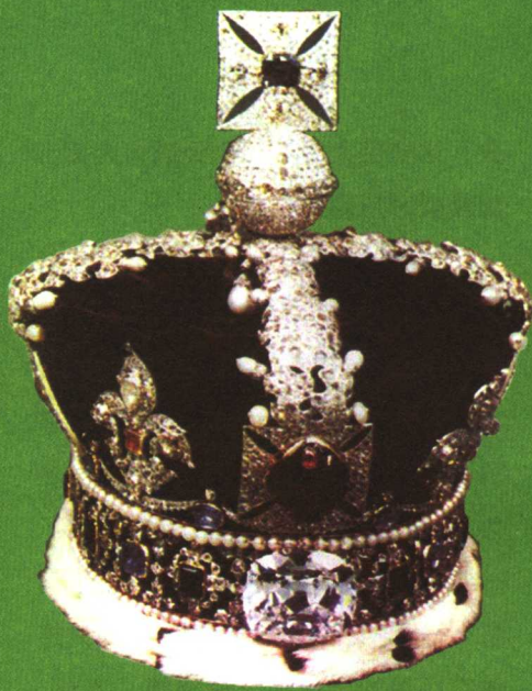
王冠上的“库里南二号”钻石

1919年，波兰人塔克瓦斯基从物理学角度研究出具有58个细小刻面的钻石才最理想。光线穿透，会一丝不漏地反射出来，并携带着云霞一样的色彩。可惜，远水不解近渴，波兰人救不了“库里南”，“非洲之星”被小心翼翼地切割成梨形，共74个折射面，它的光芒立刻喷射出来。五彩缤纷、光艳照人的巨大钻石随即镶嵌在了爱德华七世黄金权杖的头顶心。