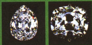
世界一号巨钻“非洲之星” “库里南二号”钻石