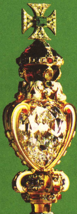
镶嵌“非洲之星”巨钻的权杖