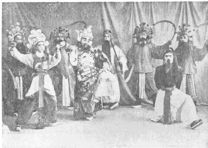
孙贖被龐涓陷害，綁赴法場問斬。