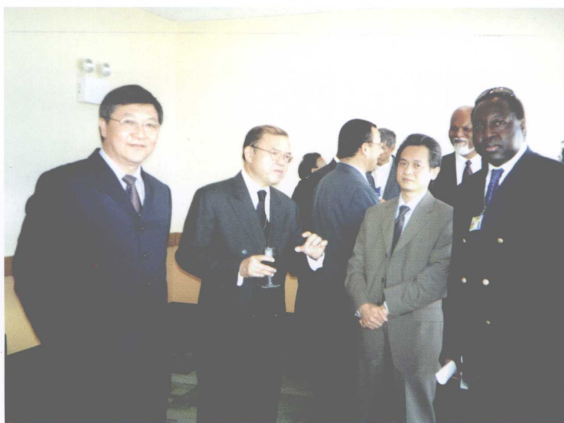
出席牙买加、南美创意产业大会