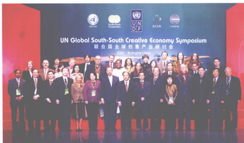
参加筹备全球创意产业研讨会