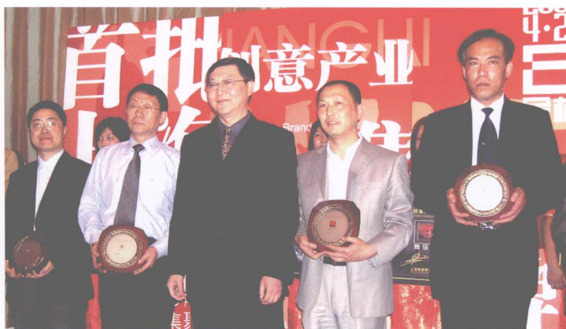
为上海首批创意产业园区授牌