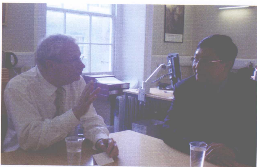
与英国文化大臣克里斯·史密斯先生商谈创意产业合作项目