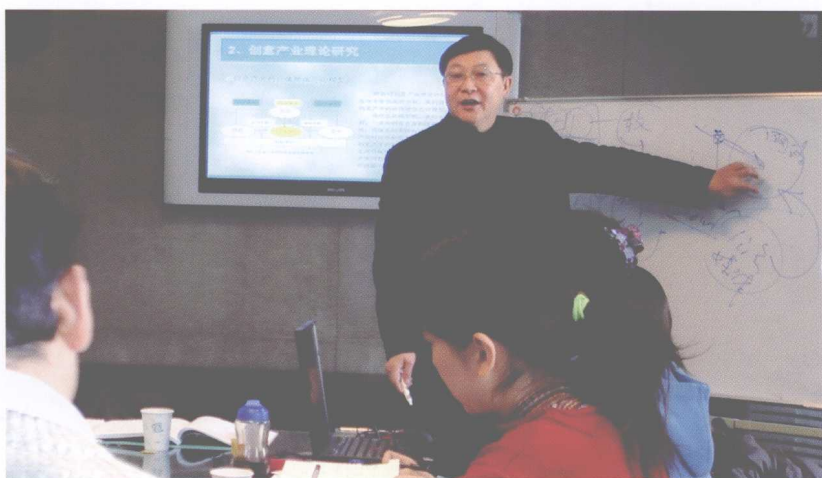
为创意学院首届 MFA(艺术硕士)学员上课