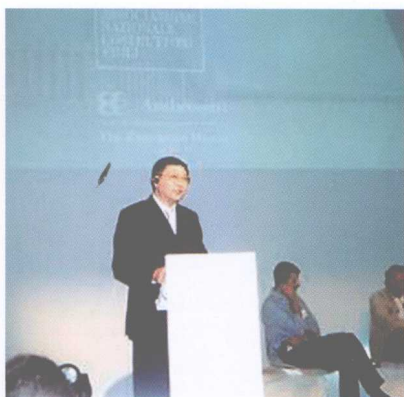
在意大利欧盟创意产业论坛上发言