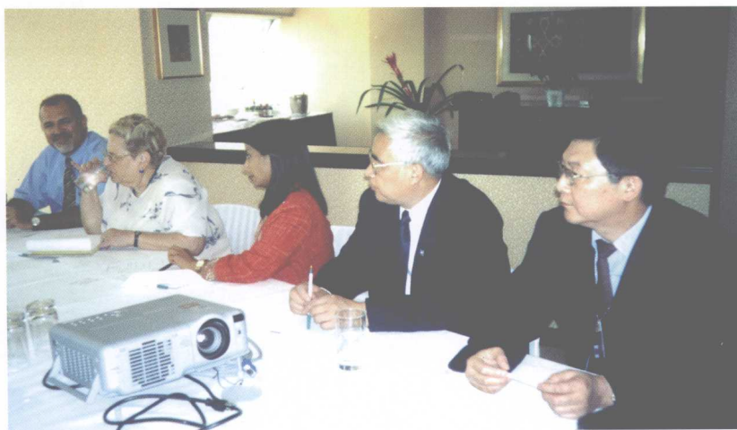
参加联合国南南合作特别局创意产业高级别专家会议