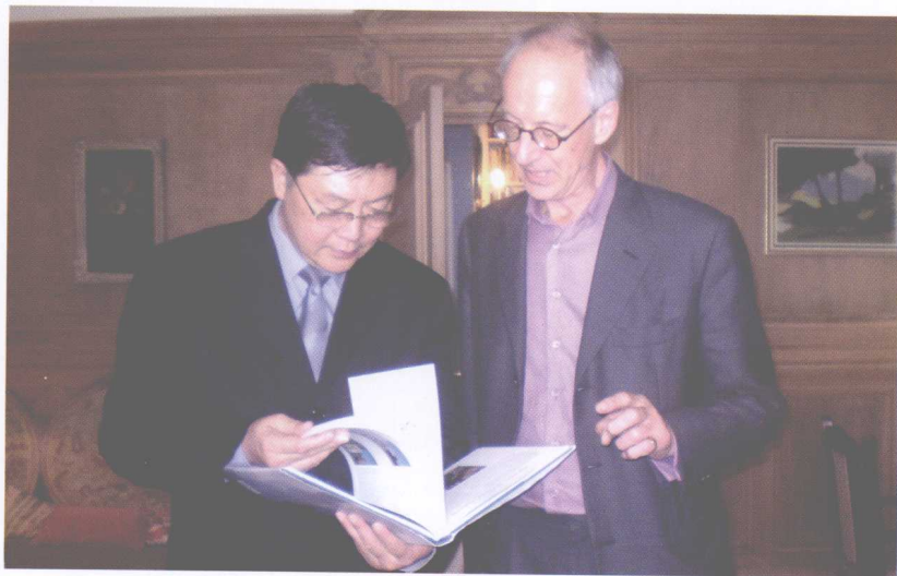
与英国著名创意产业、经济学专家约翰·霍金斯先生 研究创意经济相关课题