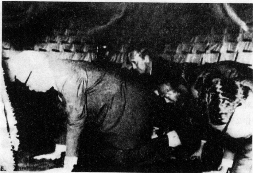
台湾省政府官员跪拜蒋介石

却跑回来投降，然后在飞机场丢人现眼，找蒋介石的照片去鞠躬。看完廖文毅再看丘永翰，也是“台独”分子，由国民党大员方志去接他，旁边的国民党大官叫林进生。一个一个投降回来。