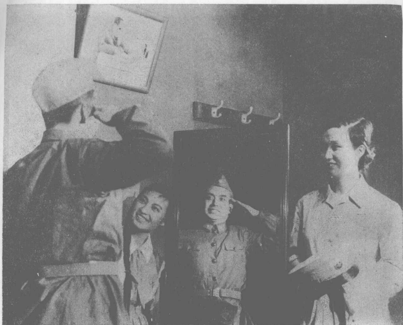
《將軍當兵》第一場劇照