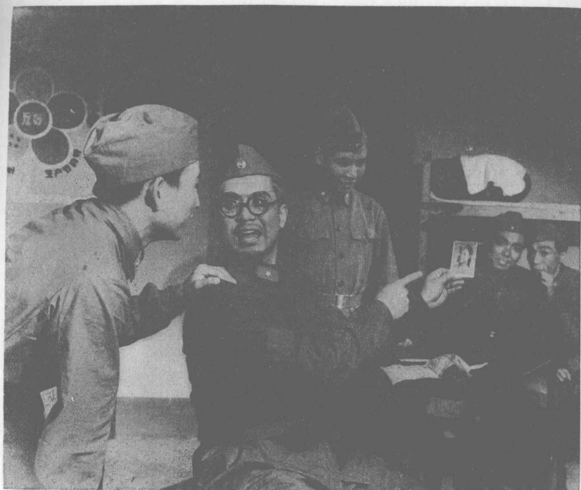
《將軍當兵》第五場劇照