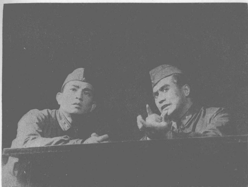
《將軍當兵》第三場劇照