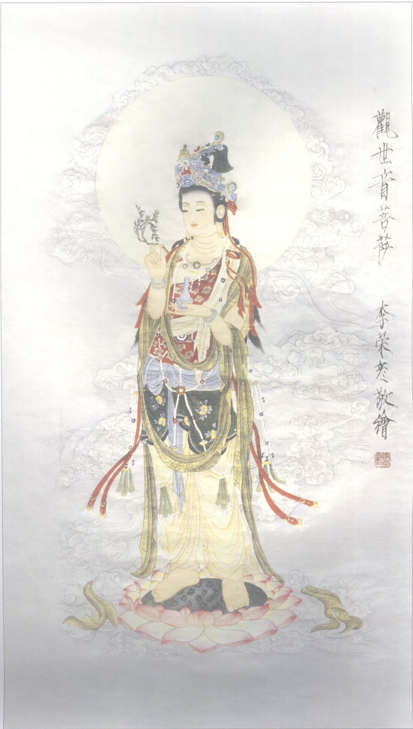
观世音菩萨 / 李荣彦