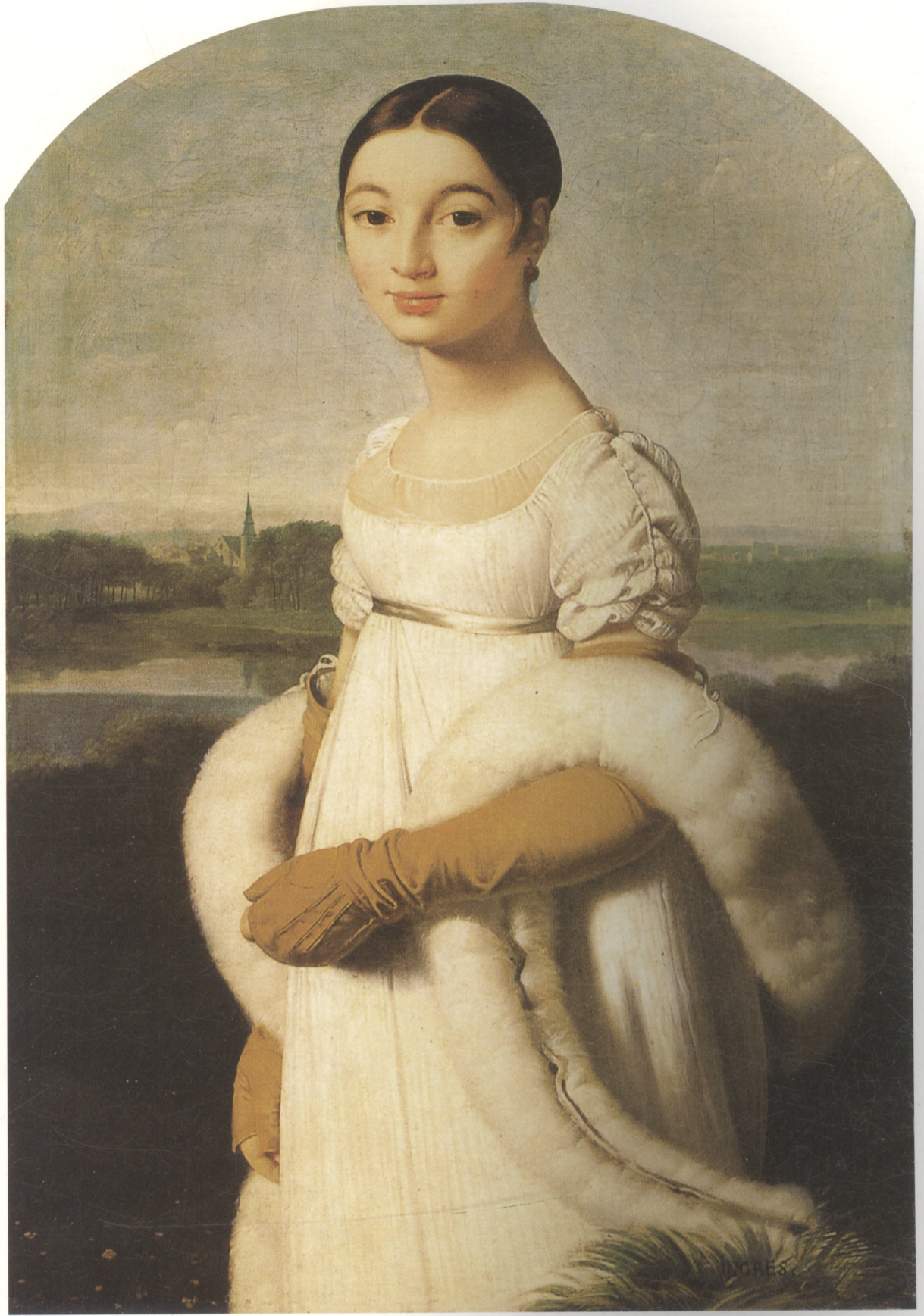
卡罗琳·里维埃小姐 布面油画 99.5cm × 64.5cm 1806年