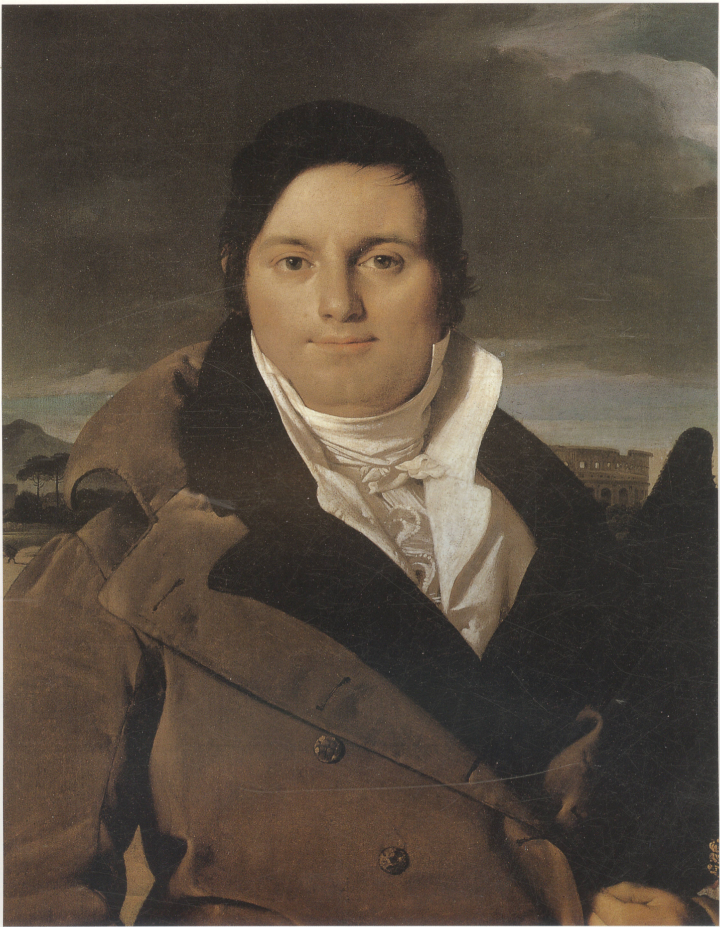
约瑟夫-安托万·蒙特多 布面油画 75.2cm x 58.1cm 1810年