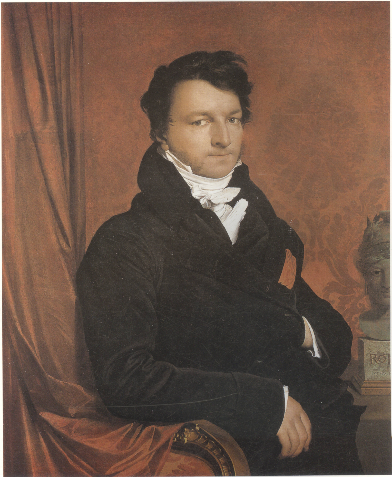
巴隆-雅克·马尔凯 布面油画 1811年