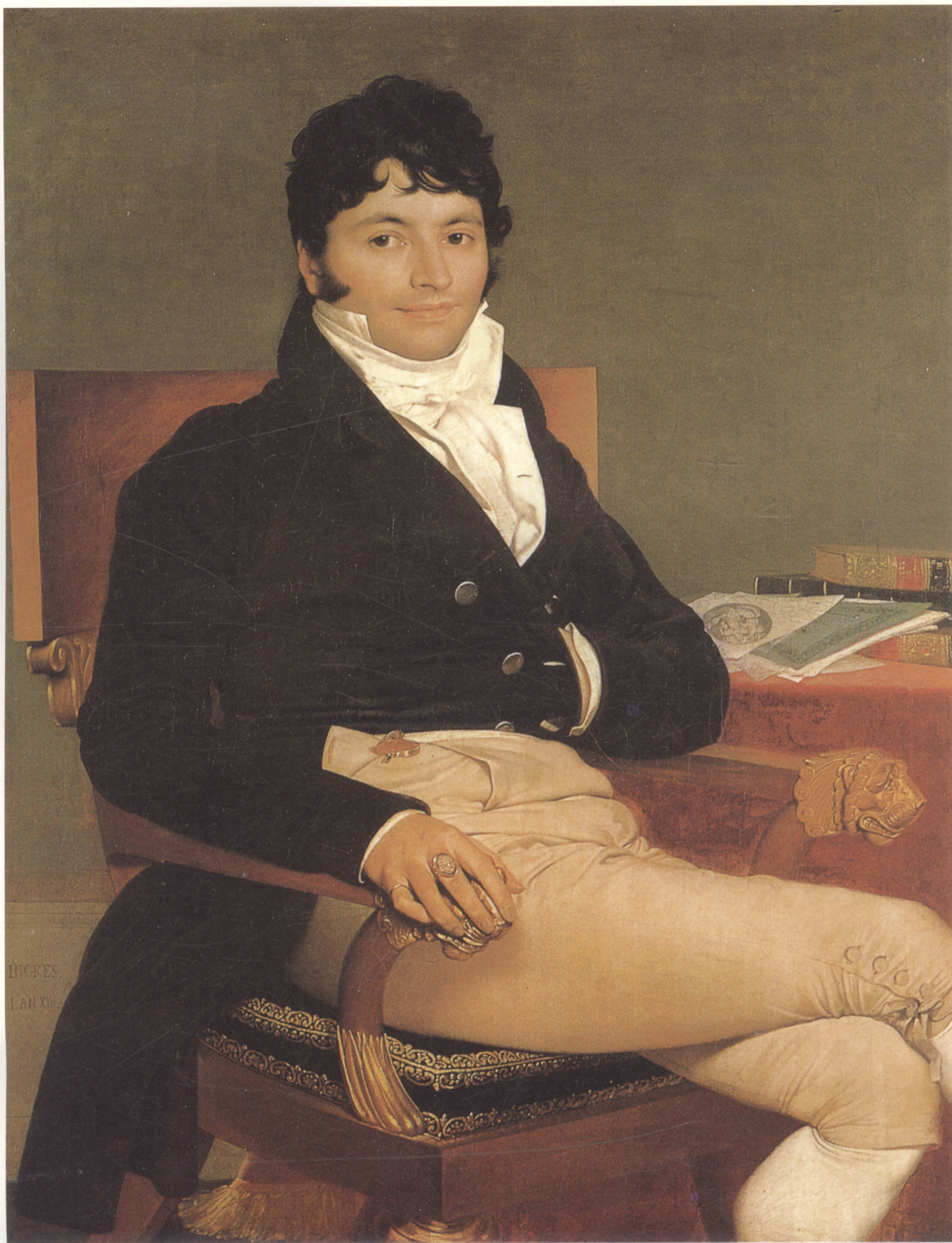
菲利贝尔·里维埃肖像 布面油画 115cm x 90cm 1804-1805年