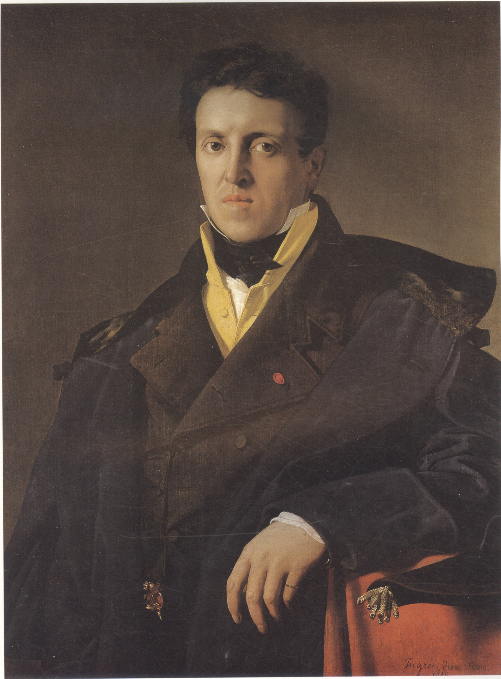
查尔斯·马克特 布面油画 93.7cm×69.4cm 1810年