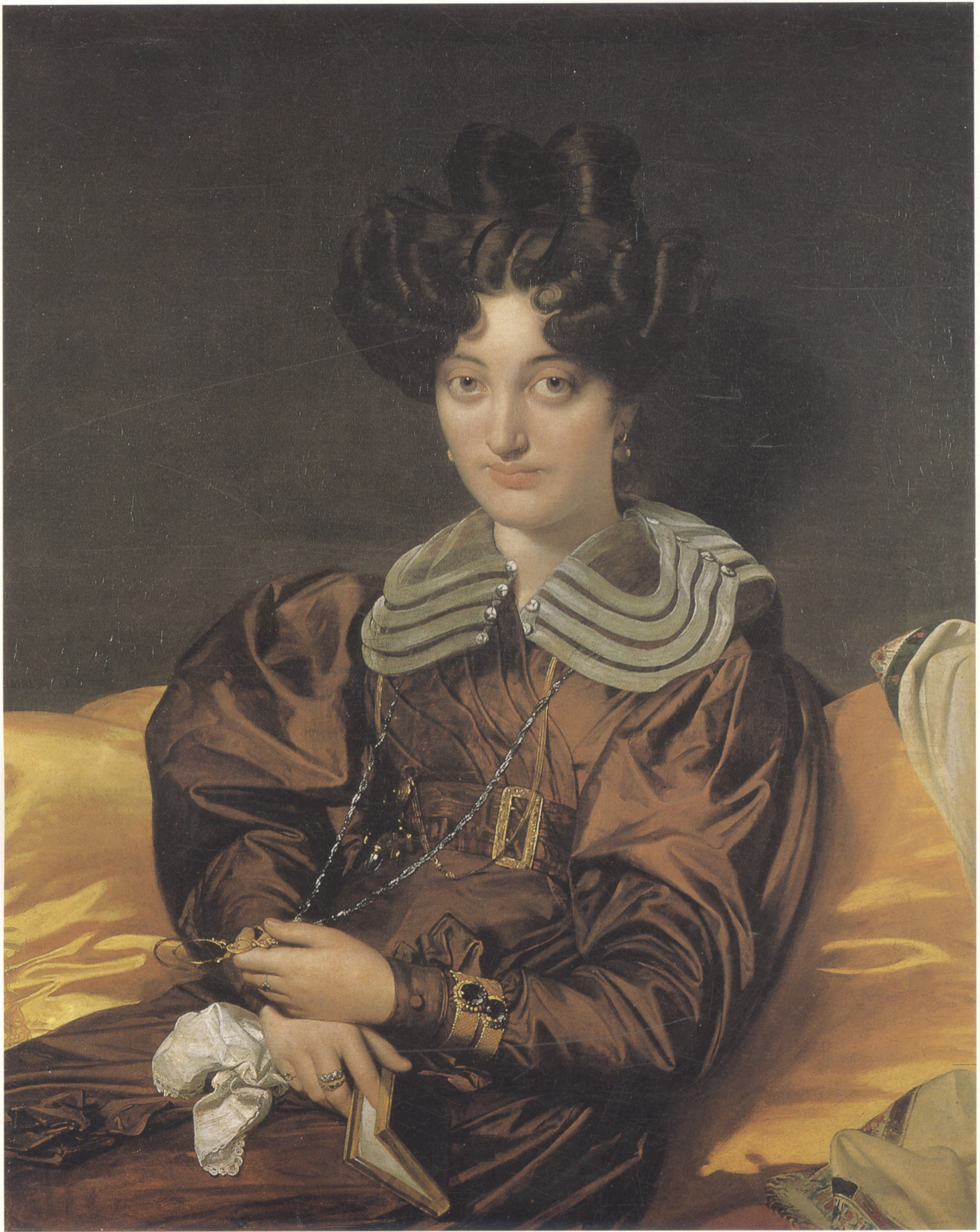
玛丽·马克特夫人 布面油画 93cm×77cm 1826年