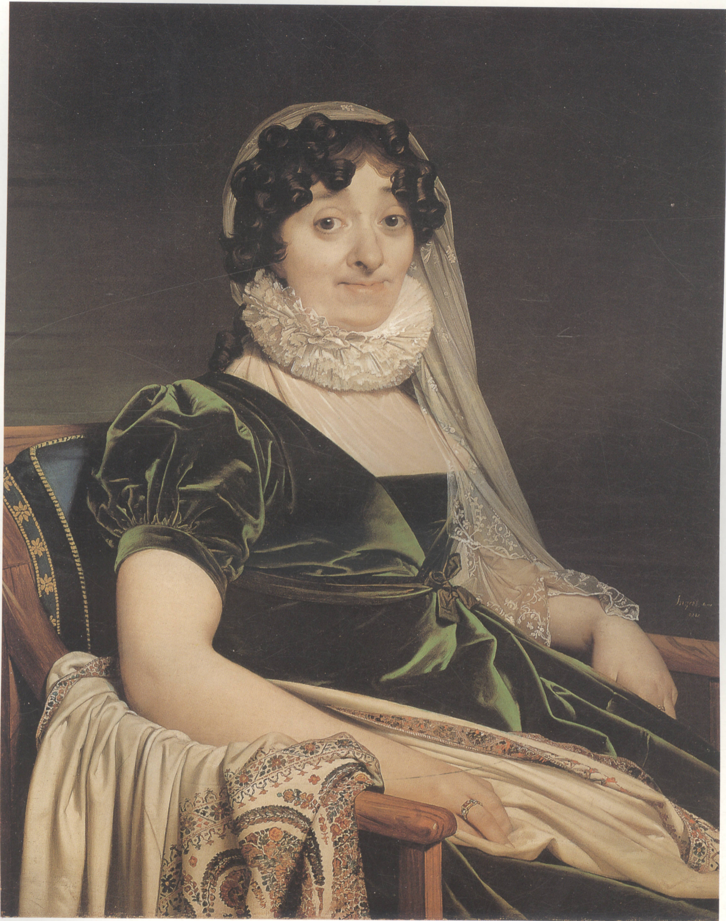
伯爵夫人，布面油画 92cm × 73cm 1812年