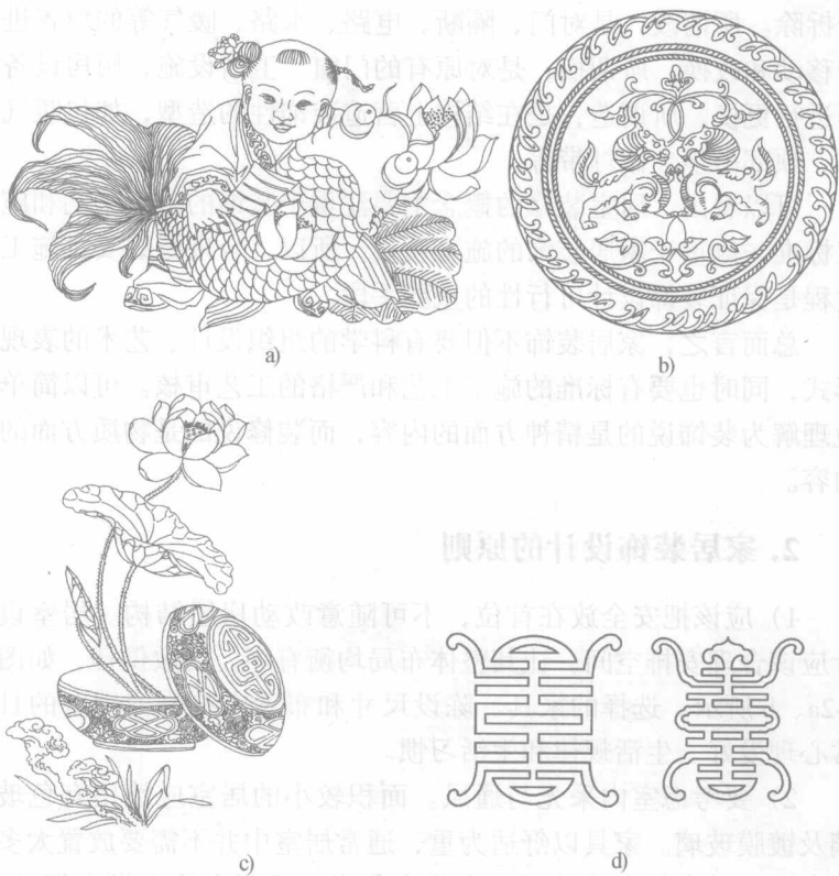
图 1-1 装饰设计中的古典装饰图案