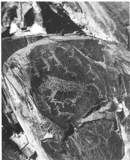
图1 猛虎捕食图 东方黑山岩画

如果从艺术的本体来考察原始艺术不能称之为艺术，之所以今天我们称其为“原始艺术”这中间存在一个长期的认识论的转换过程。因为原始社会艺术还没有达到真正的自觉，对于原始先民艺术乃是一种无意识的存在。我们今天称之为的原始艺术就其内容而言，大多表现了原始人类对生存、狩猎等原始活动的某种祭祀或崇拜。就其形式而言，他们大多采用写实的手法（东方艺术当中也包括一种有规律的抽象造型），即对被造型之物的简单再现。在此，东西方原始艺术有着很多共通之处。