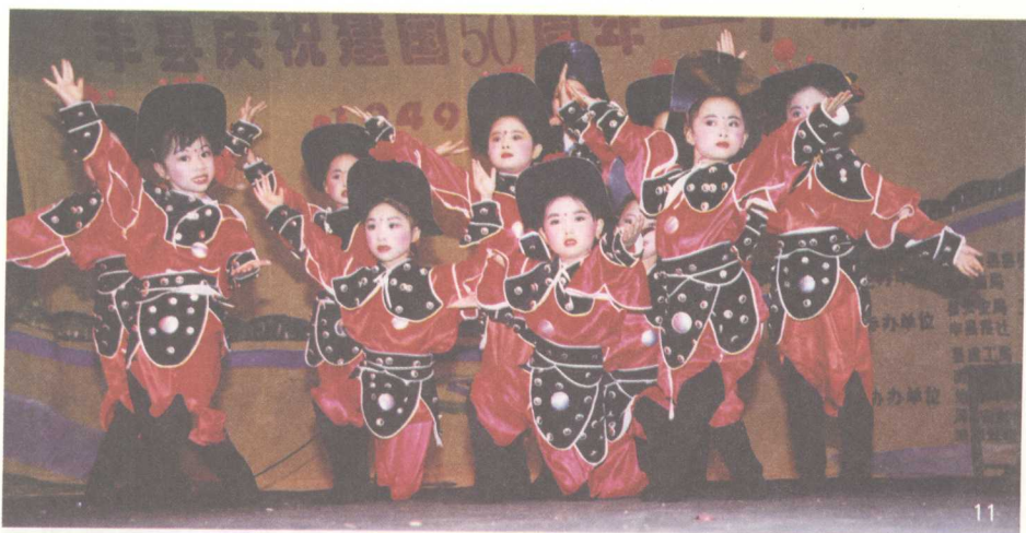
11. 12. 小凤凰梆子剧团在演出