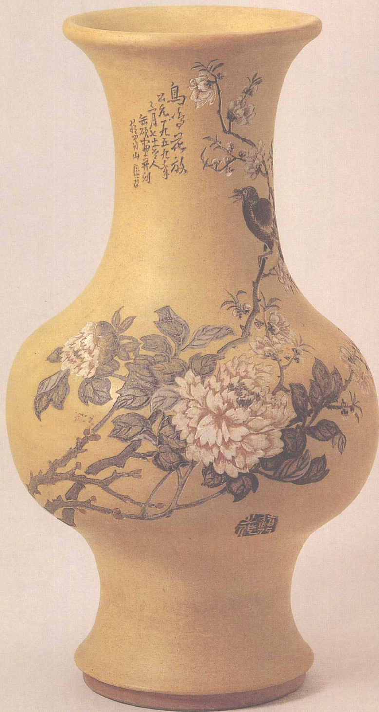
任淦庭 陶刻牡丹瓶