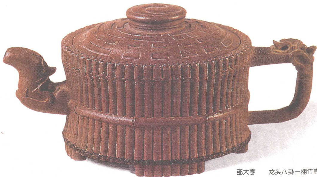
邵大亨 龙头八卦一捆竹壶