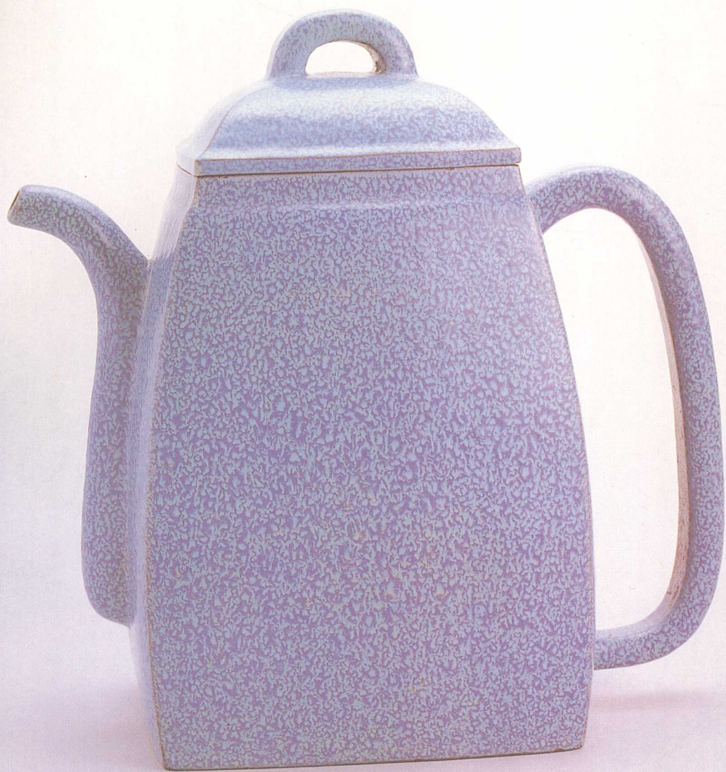
华凤翔 炉钧釉紫砂方壶