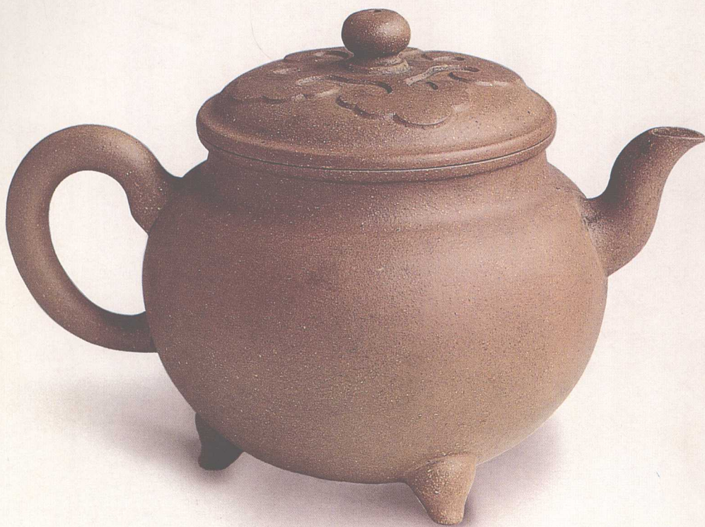
无锡出土时大彬如意纹盖壶