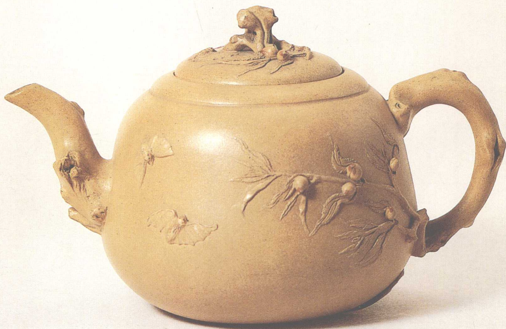
裴石民 五蝠蟠桃壶