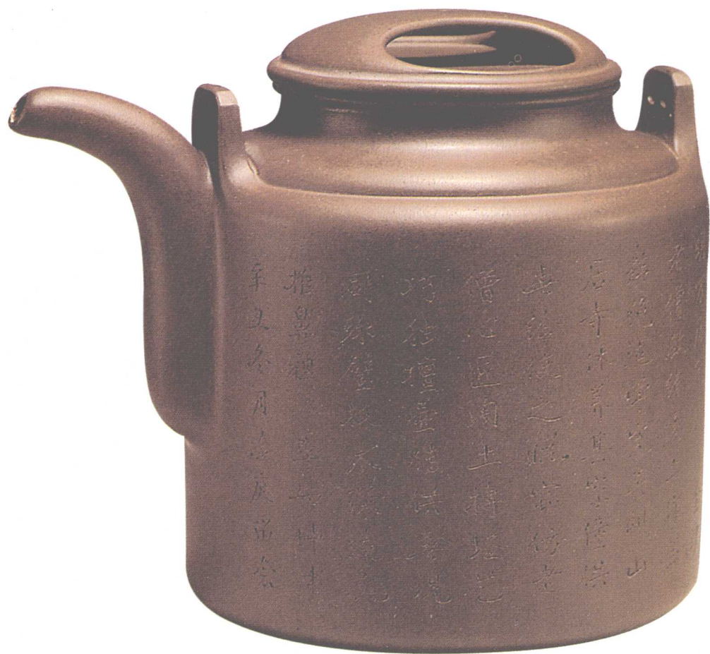
吴云根 牛盖洋桶壶