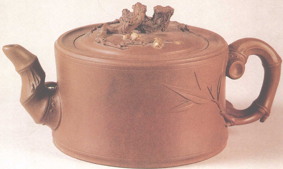
朱可心 竹段松梅壶