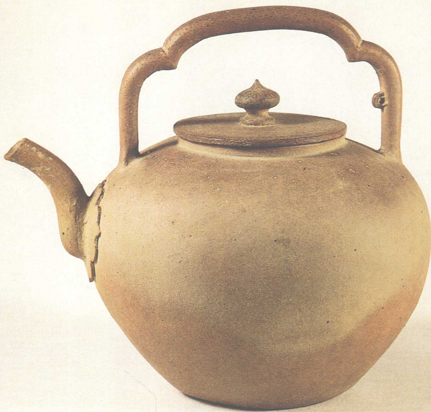
南京中华门外马家山油坊桥明代司礼太监吴经墓出土提梁壶（正）