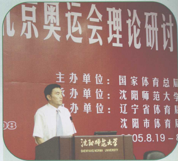
作者在 2008 年北京奥运会 理论研讨会上作大会发言