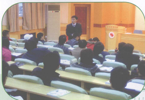
作者多次给北京体育大学博士生 作维护体育秩序的报告