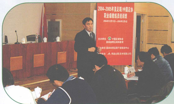
作者曾给亚足联举办的教 练员培训班的学员，作维 护赛场秩序的报告