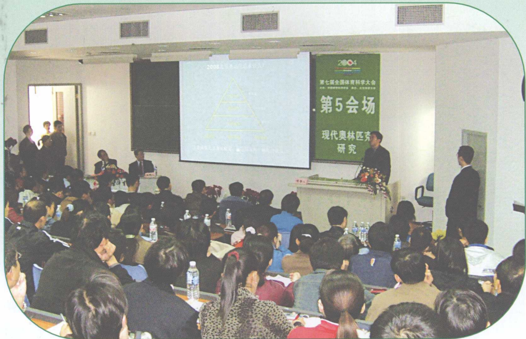
作者在第七届全国体育科学大会上作《奥运对和平的追求——促进北京奥运会稳定与中国和平发展》的主题报告，引起国内许多学者的关注。

作者在七科大宣读论文后，与北京体育大学的博士和国内青年学者针对奥运追求和平的问题进行了讨论。