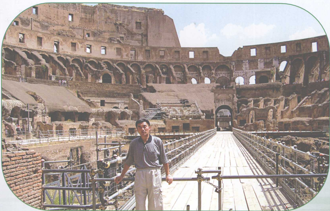
作者在意大利，考察了古罗马斗兽场的遗址。