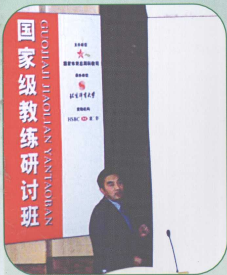
作者多次给国家级教练员 作奥运与竞技教育的报告