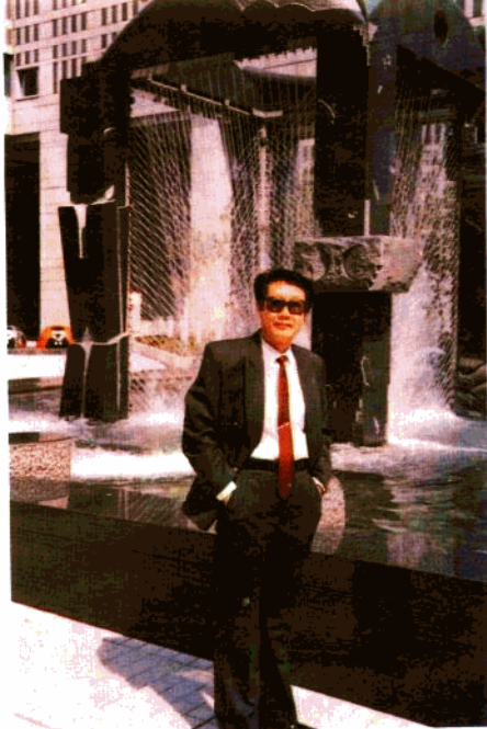
东京市政厅大楼前