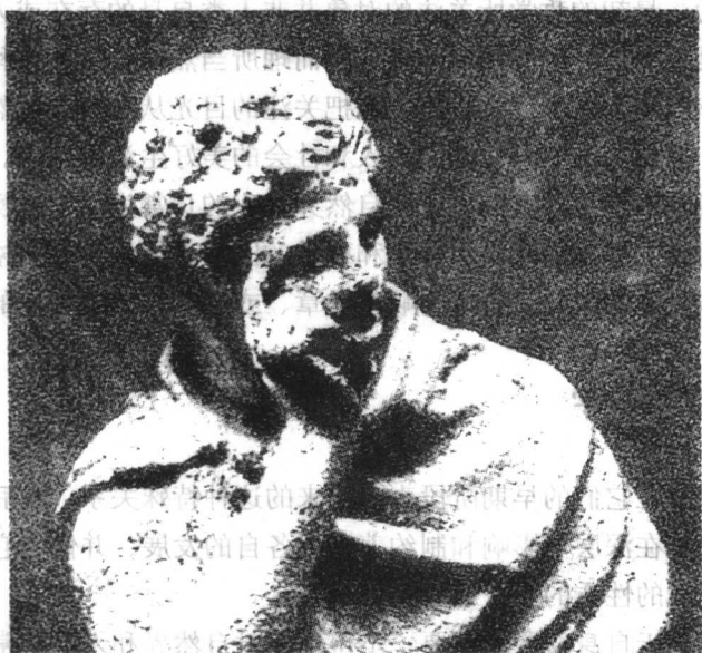
图 1-1-2 哲学家

候，总是有那样一些哲学家或多或少地表现出，要么把哲学降低到只是为科学作方法论的辩护，以科学的语言代替哲学的语言的地步；要么拒绝一切对哲学的批评和非议，把这种批评和非议看作是对哲学的一种不能容忍的恶意诽谤和攻击。这表明，在哲学与科学关系的问题上，实践中表现出来的问题远比理论上所能描述的更为复杂得多。由此也决定了，任何对哲学概念的探讨，都不能离开哲学这种特殊的思想形式和理论形式在历史上所经历的变化和发展的如此背景。