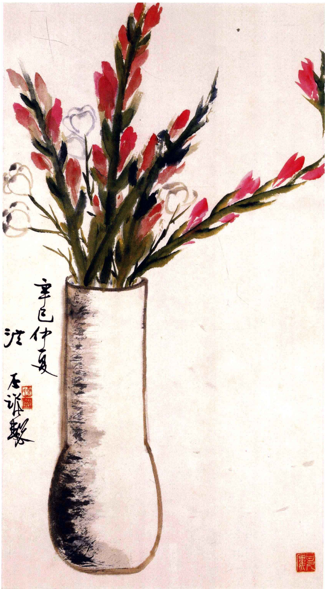
菖兰花 75 × 40cm