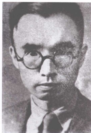
朱自清 中国文学系教授 兼主任