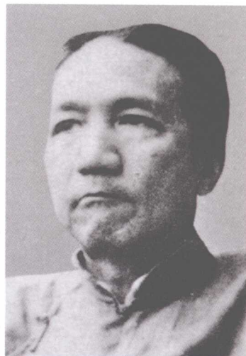
陈寅恪 中国文学系教授 历史学系教授