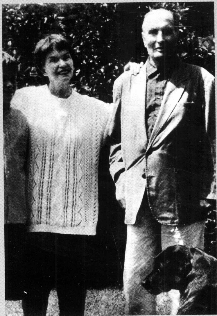
密特朗与他的家人合影。