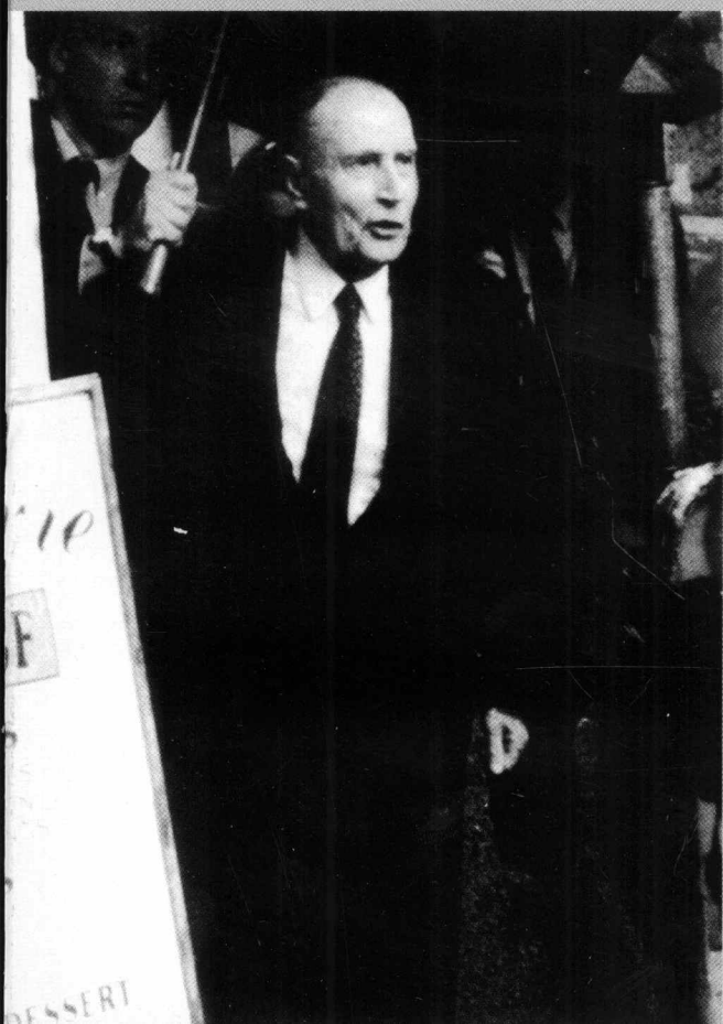
1988年5月10日，密特朗(右)再次当选法国总统。