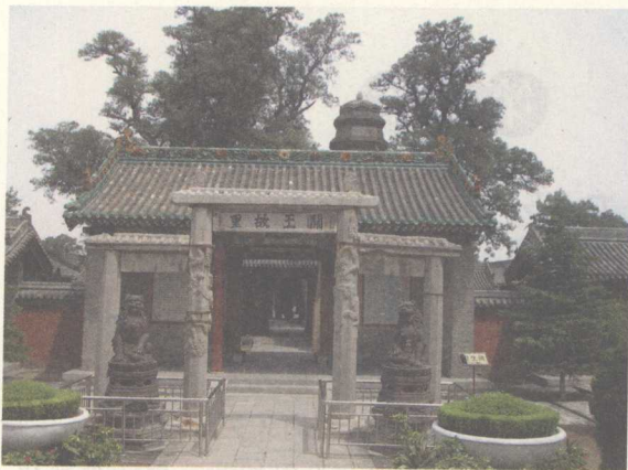
山西省运城市盐湖区常平关帝家庙 “关王故里”石碑坊