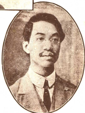
行政院長譚延闓(右上)-立法院長胡漢民(左上) 監察院長蔡元培(中央)-司法院長王寵惠(右下) 考試院長戴季陶(左下)