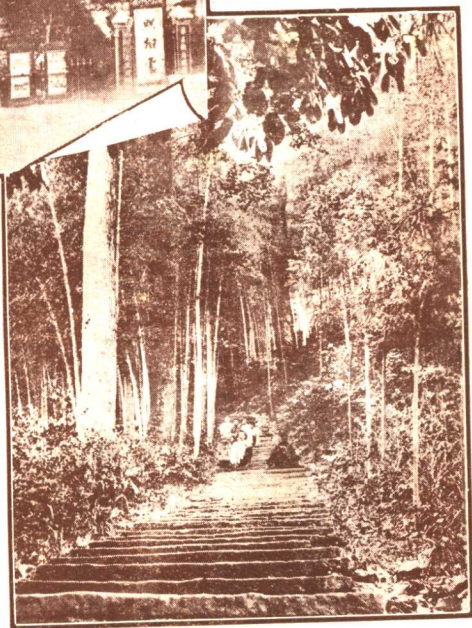
武昌奥略楼(上)西湖韬光行径(下)