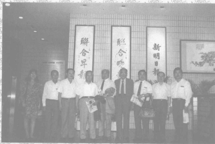
賀普仁教授在新加坡访问讲学