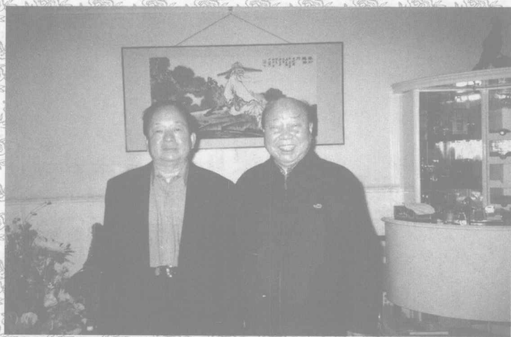
贺普仁教授与前国务院副总理田纪云在一起