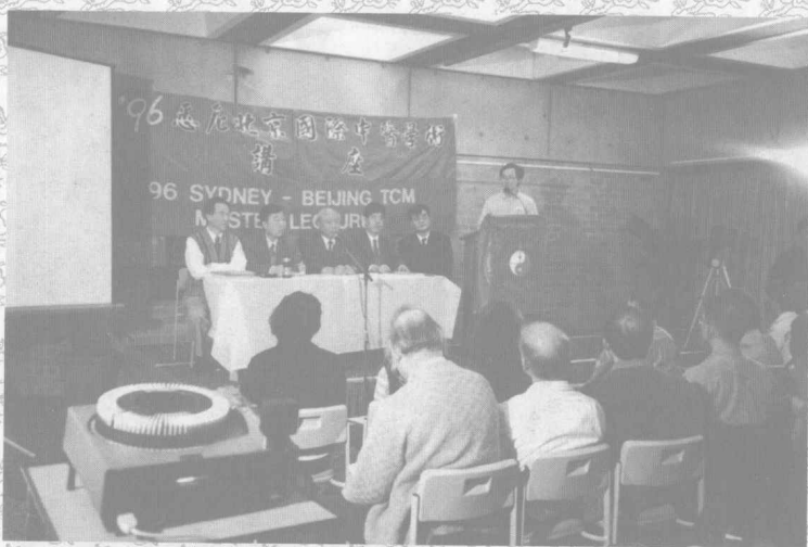
1996年, 賀普仁教授在澳大利亚讲学